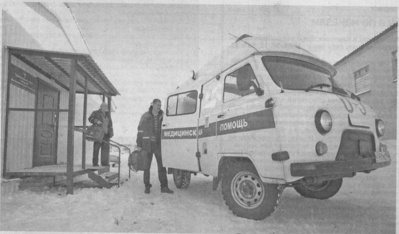
«СКОРАЯ» СТАЛА БЛИЖЕ. Вчера в селе Поперечное Юргинского района в 1 км от федеральной трассы М-53 открылся второй в Кузбассе трамвопост «Скорая помощь». Бригада врачей будет обслуживать участок в радиусе 60 км. При легких травмах пострадавшему помощь окажут на месте, в случае серьезных повреждений доставят в ближайшее лечебное учреждение. Время доставки сократится на 30–40 минут. Из областного бюджета было выделено около 3 млн руб. Первый трамвопост открылся в селе Красный Яр Ижморского района в декабре 2013 года.