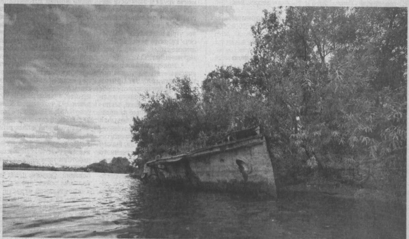
ТАЙНЫ ТОМИ. Вросший в берег Томи старый колесный паровоз в глухом месте возле протки Лагушь (это где-то между Новокузнецком и Кемеровом) удалось запечатлеть нашему корреспонденту, сплавлявшемуся по реке. Говорят, что паровоз здесь стоит уже 100 лет. Дорог и селений поблизости нет. Правда, в прошлом году к нему пробрались путешественники. Фотоотчет об этом есть на одном из туристических форумов. «Кузбасс» планирует вернуться к этой теме и просит тех читателей, кому что-либо известно об этом паровозе, связаться с редакцией.