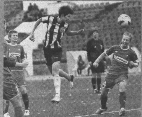
Футболистки «Кузбасса» вновь доказали, что способны бороться за самые высокие места.