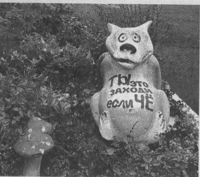
«Мы сами из гипса слепили веселых и добрых друзей!»