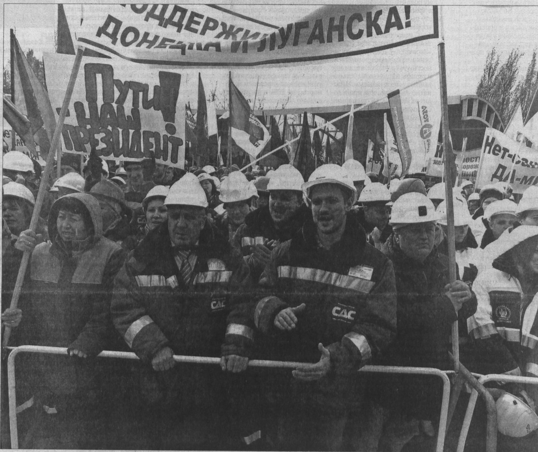
На митинг в Кемерове собрались представители политических партий, общественники, профсоюзы и, конечно, рабочие.