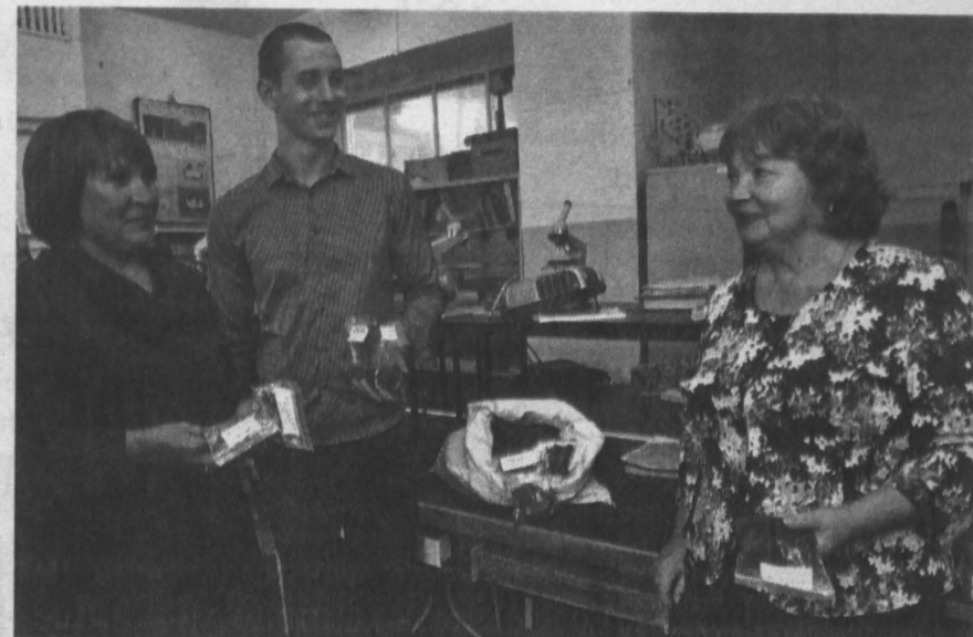
Создатели сапропелевого рекультива в лаборатории КемГУ обсуждают варианты применения своей разработки на практике.