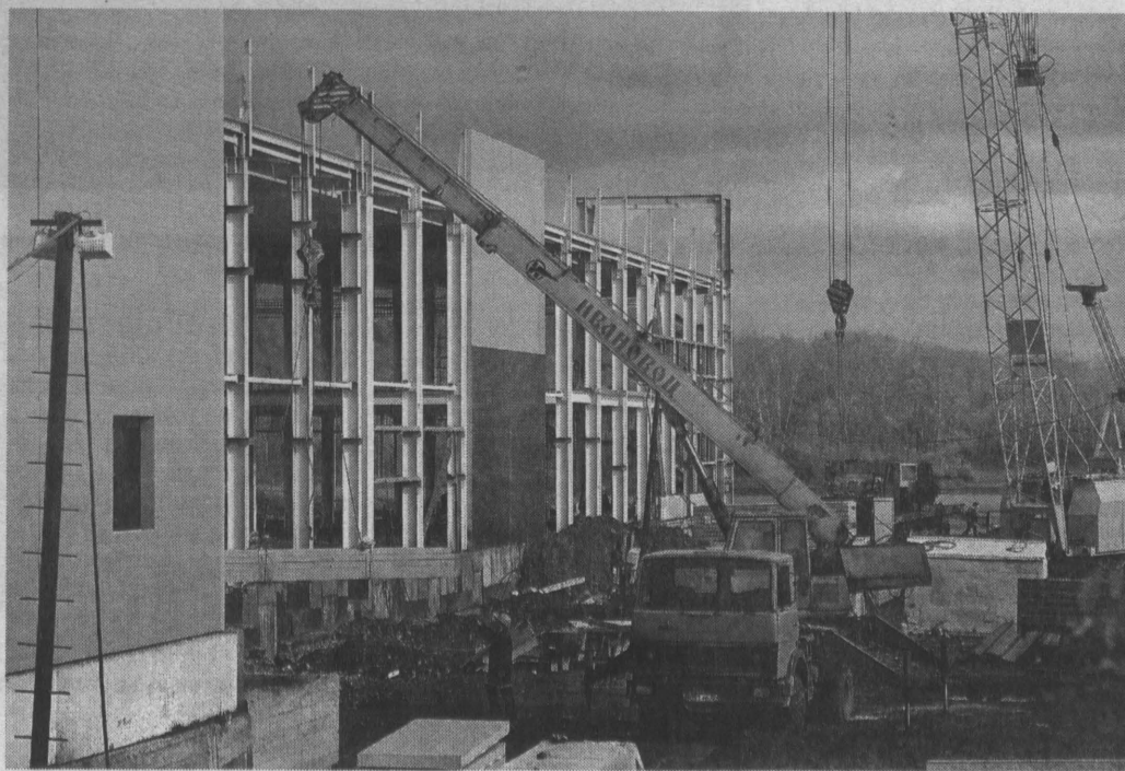
Когда в Новокузнецке на левом берегу Томи будет достроена еще одна «Лента», много работников потребуется и туда.

Стоит отметить, что и показатели сокращения штатов у нас впечатляют. С января по сентябрь текущего года потеряли работу около 14 тысяч кузбассовцев. А в настоящий момент готовятся покинуть свои рабочие места к концу года еще 4981 человек. Из сельских районов в лидерах по числу высвобождаемых будут Гурьевский и Промышленновский, а из городов — Киселевск, Новокузнецк, Прокопьевск. Есть у нас и территории, где сохраняется режим неполной занятости. В Анжеро-Судженске, например, в таком режиме трудятся 193 человека, в Кемерово — 452, в Новокузнецке — 272. В такой ситуации значимость создания новых рабочих мест особенно очевидна. Но кого ждут в новых пехах и на участках? Ведь и сам работник тоже должен быть на уровне современных требований. Скажем, целая революция сейчас происходит в строительной отрасли. А готовы ли к ней претенденты на вакансии? В нынешнем году в компании ООО «Кемеровский ДСК», например, произошло замечательное событие — запуск цеха крупнопанельного домостроения. Здесь применяются новейшие технологии немецкой фирмы с мировым именем. Для работы цеха уже в начале года было создано дополнительно 139 рабочих мест, в том числе 90 высокопроизводительных. А сейчас, как поведа-