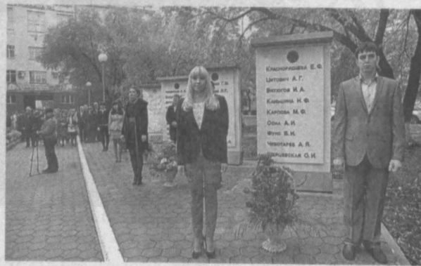
Мемориальные стелы у городской клинической больницы Новокузнецка №1.