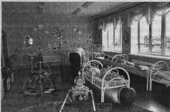
■ Для каждого ребенка здесь предусмотрена индивидуальная программа реабилитации.