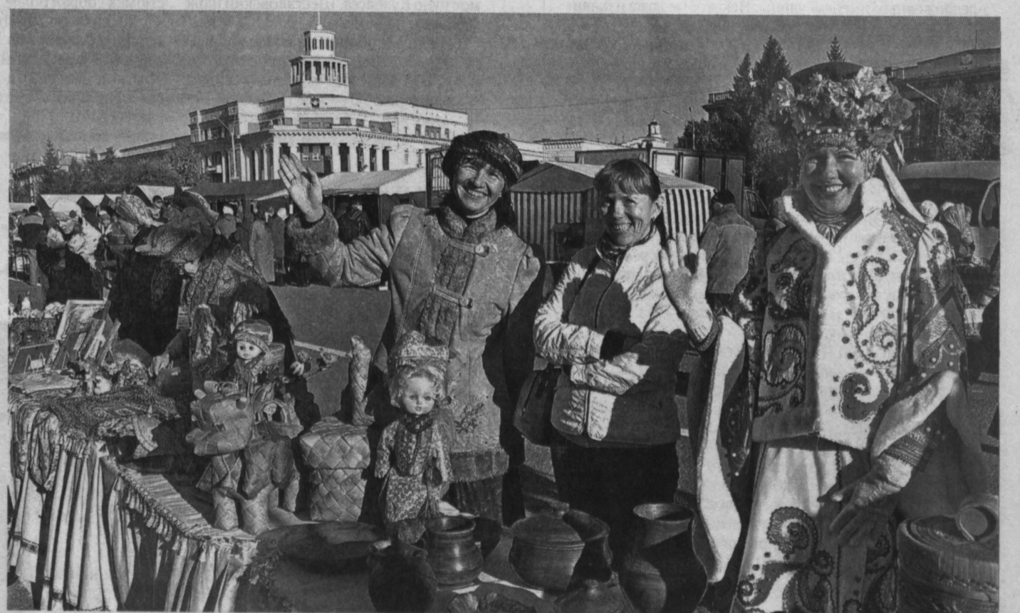
■ «ЕШЬ, ПЕЙ - СВОЕ!» - под таким лозунгом вчера в семи городах Кузбасса - Кемерово, Новокузнецко, Белове, Киселевске, Прокопьевске, Анжеро-Судженске и Междуреченске - прошли губернаторские ярмарки местных товаропроизводителей. Их задача - помочь обеспечить кузбассовцев местными продуктами по ценам ниже среднегогородских на 10-15%. Свою продукцию представили фермеры, предприятия сельского хозяйства, пищевой и перерабатывающей промышленности, оптовой торговли. Отдельные места были выделены дачникам для продажи излишков выращенного урожая.