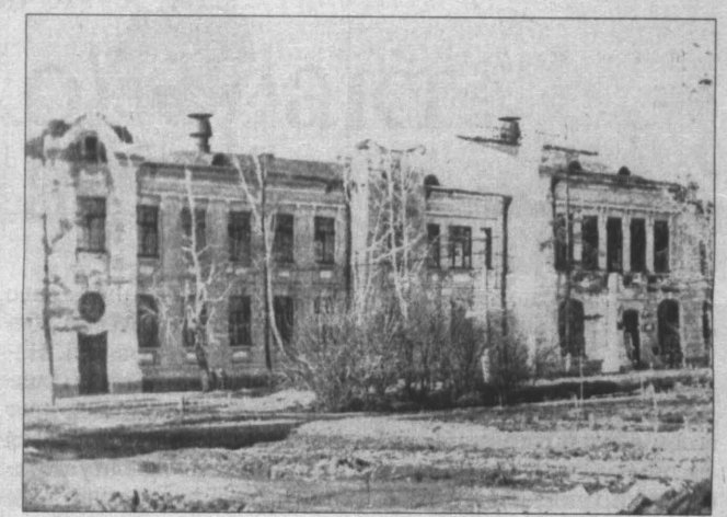
Здание Учительского института на улице Гончарной в Рудничном районе Кемерова. 1953 год.