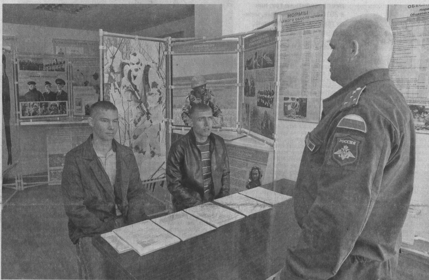
Вначале каждому кандидату на военную службу по контракту подробно рассказывают о будущих перспективах, после чего их ждут психологические тесты.

У выпускников гражданских вузов теперь есть выбор: пойти служить в армию по призыву и один год жить в казармах – либо подписать контракт на два года военной службы с достойной зарплатой