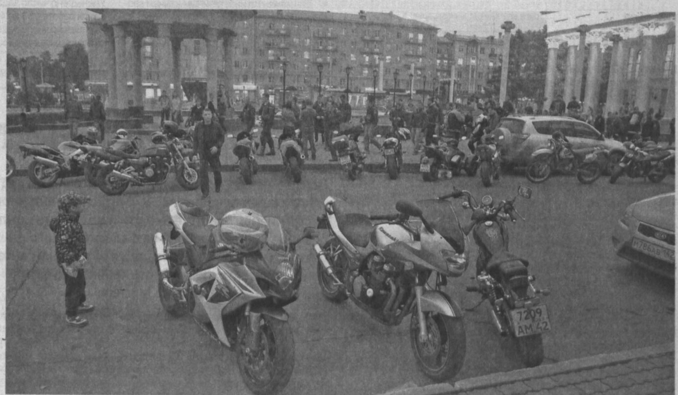
ПАМЯТИ ТЕХ, КТО НА «ВЕЧНОЙ ТРАССЕ». Вчера на Театральной площади Новокузнецка собрались любители и поклонники мотоциклов, чтобы почтить память байкеров, ушедших из жизни на дорогах страны. Акция была недолгой. Представители городского байкерского сообщества рассказали собравшимся об истории мероприятия, вспомнили, кто, когда и где ушел на «вечную трассу», почтили их память минутой молчания. Впервые День погибших байкеров провели в 2007 году на Украине. Теперь эта дата стала памятной и в России. Ее отмечают во многих крупных городах.