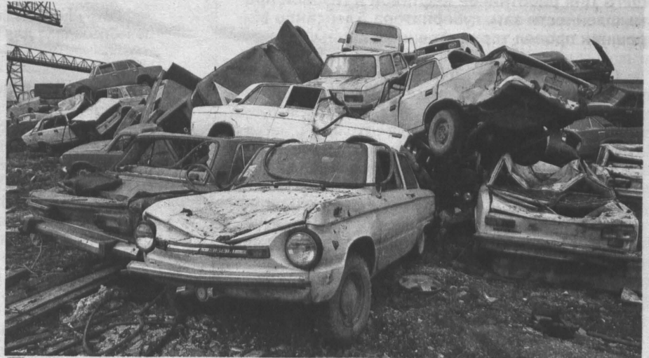
Желающих «обновить» свое авто в Кузбассе может оказаться немало.

Улучшилось настроение и у представителей нероссийских брендов, собираемых в нашей стране. Ведь предыдущий «пилот-