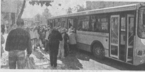
Теперь этим маршрутом будут пользоваться и жители поселка Мир.