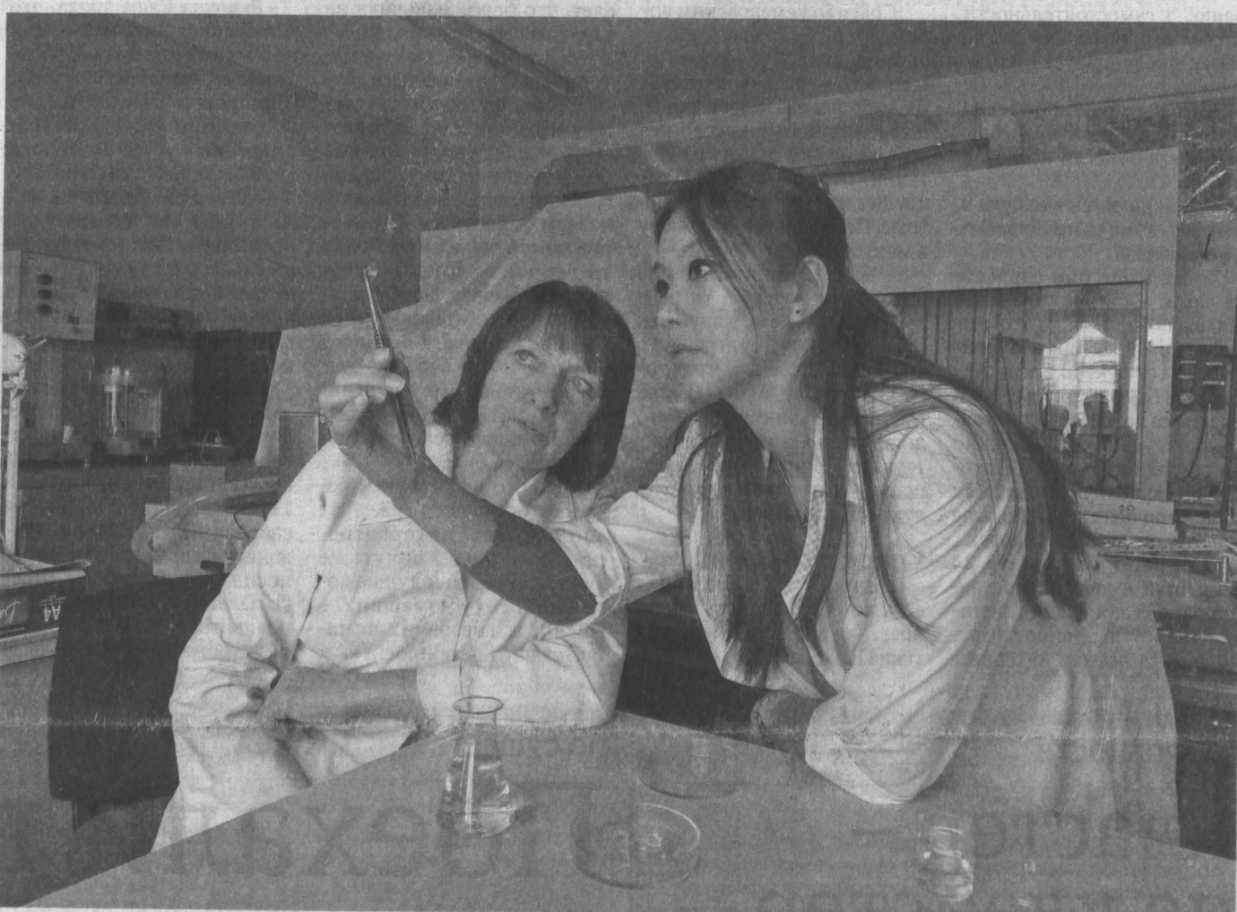
Сотрудники малого инновационного предприятия «Линкомед», действующего на базе КеМГУ, занимаются разработкой лечебных линз для глаз.

В Кузбасском технопарке прошло первое рабочее совещание представителей малого и среднего бизнеса, занимающихся инвестиционной, инновационной и производственной деятельностью в области биомедицины