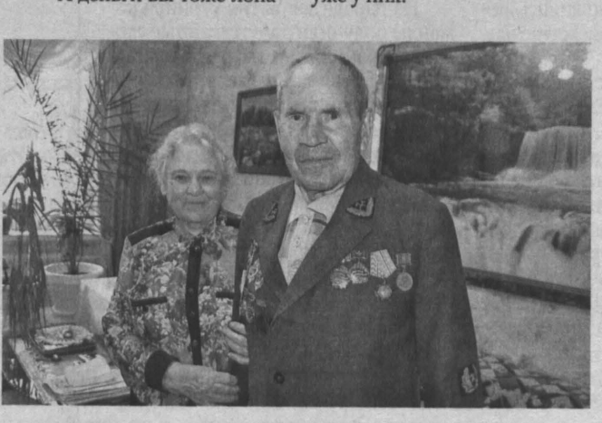
Всю жизнь – рядом!

Книги предоставлены магазинами «Аристократ» и «Буква».