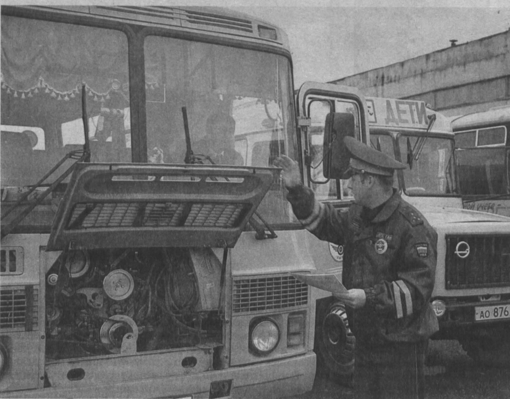
Накануне нового учебного года сотрудники ГИБДД проверили все школьные автобусы в Кузбассе, эксплуатация двадцати из них была запрещена.