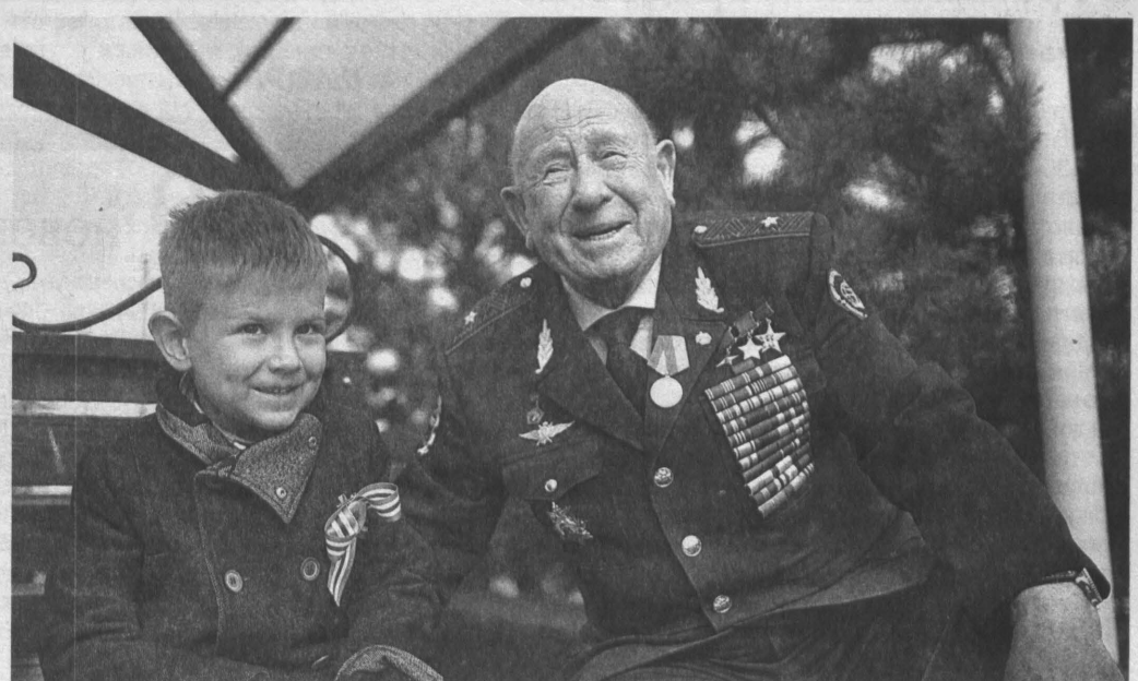
На празднике в Новокузнецке разные поколения кузбассовцев объединила гордость за родной край.