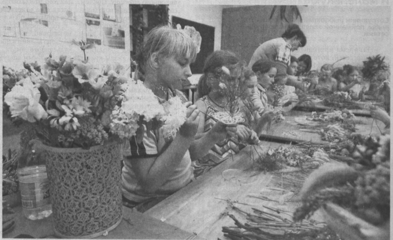
ШАХТЕРСКИЙ БУКЕТ. В Кемерове городская станция юных натуралистов в преддверии главного шахтерского праздника провела для ребятшек начальных классов мастер-класс по фитоделанию. Ленон, ксерантемум, седум, амарант, цинния, роза, щетинник, статица, львиный зев — не полный перечень цветов, из которых ребята учились мастерить подарочные букеты. На праздник они смогут смастерить их самостоятельно и подарить родным и близким. К слову, в отделе фитоделания на станции юных натуралистов сегодня занимается около 200 школьников со всего города. Все цветы для букетов были выращены на учебно-опытном участке при городской станции.