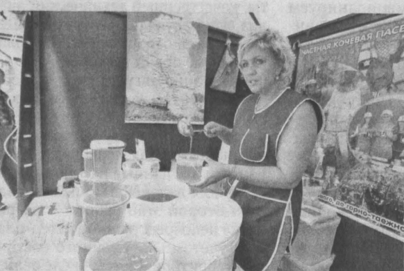
Медовая ярмарка открылась на Медовый Спас.