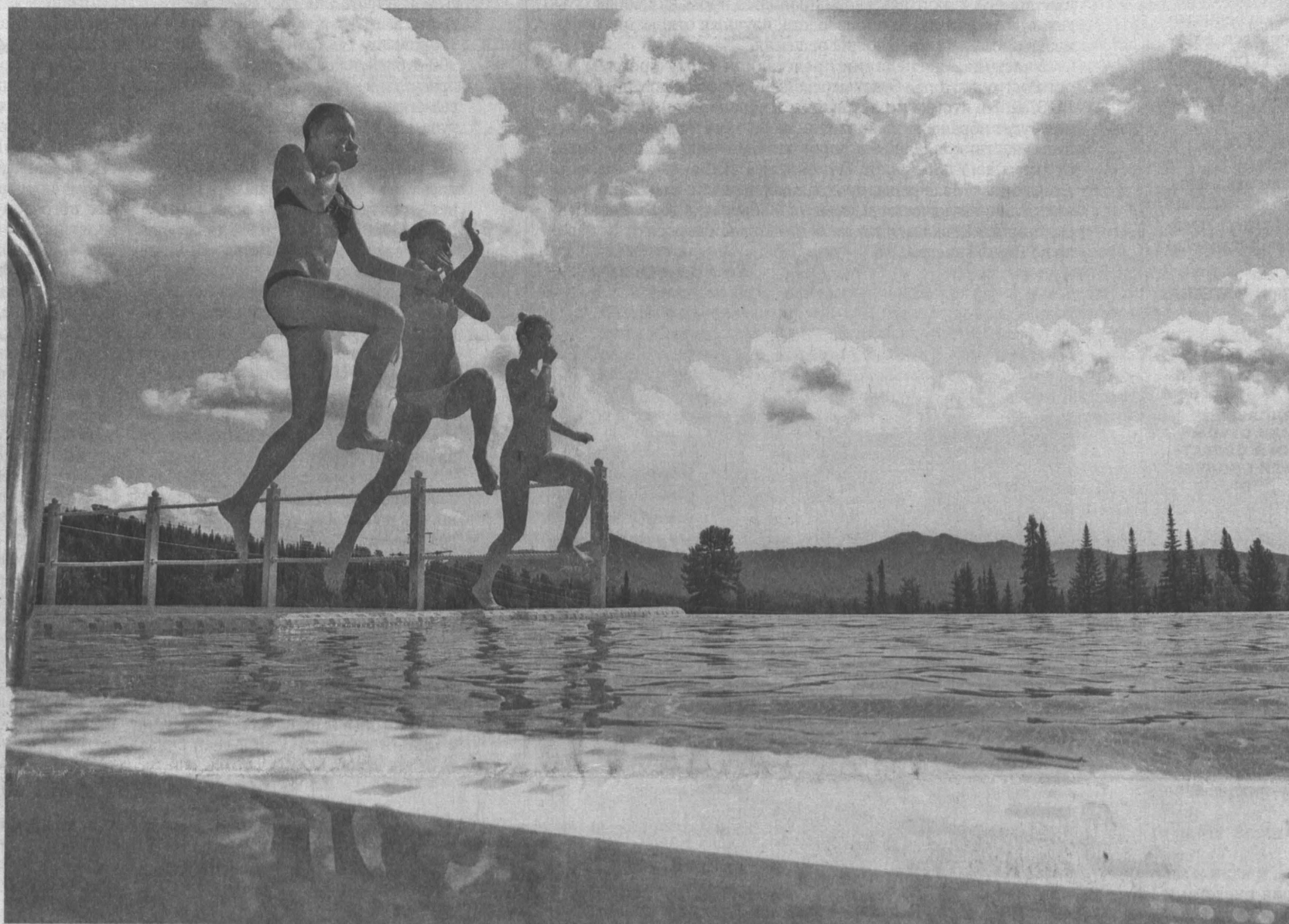
Летний туризм в Шерегеше развивается: теперь и услугам отдыхающих и большой бассейн.

Спортивно-туристический комплекс «Шерегеш» включен в федеральную целевую программу развития внутреннего и въездного туризма на 2015-2018 годы. Мастер-план по его развитию и проект планировки курорта планируется завершить уже к началу следующего года. Главная задача — превратить Шерегеш во всепогодный курорт мирового уровня.