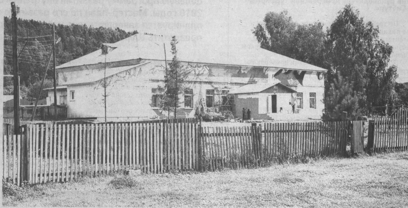
Здание прямо на глазах превращается в арт-объект.

Оригинал этого материала: http://novolitika.info/news/130301