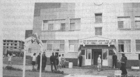
Открытие уже третьего по счету детсада в городе-спутнике.