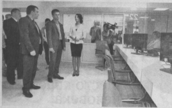
Вчера торжественно открыли МФЦ.