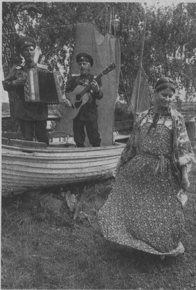
Символическое путешествие на струе времени.

из реки набрать: кто ею в этот день умоется, тот краше всех будет да о болезнях забудет. Девушки, кстати, при умывании должны приговаривать: «Пусть меня так же любит молодцы, как любят хмель добры люди». Ну, вы понимаете, что отбоя от до-