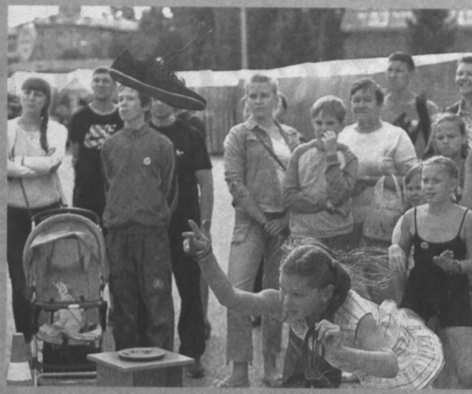
Теперь в планах устроителей чемпионата по метанию обуви сделать его зимнюю версию.

Как и полагается в спортивных состязаниях, были