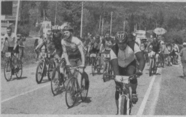
В этом году велофестиваль собрал много не только участников, но и зрителей.