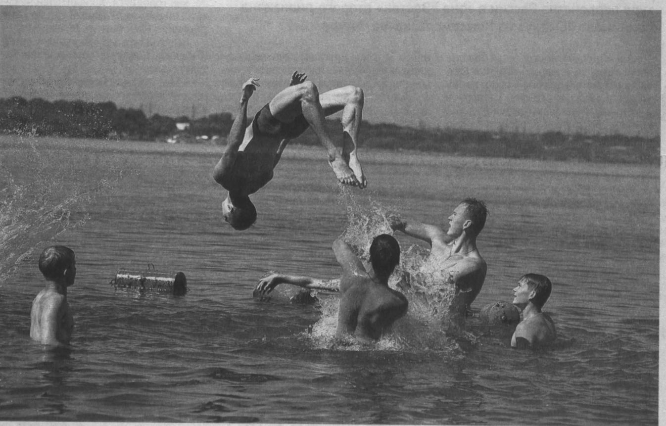
Красиво купаться тоже надо уметь!