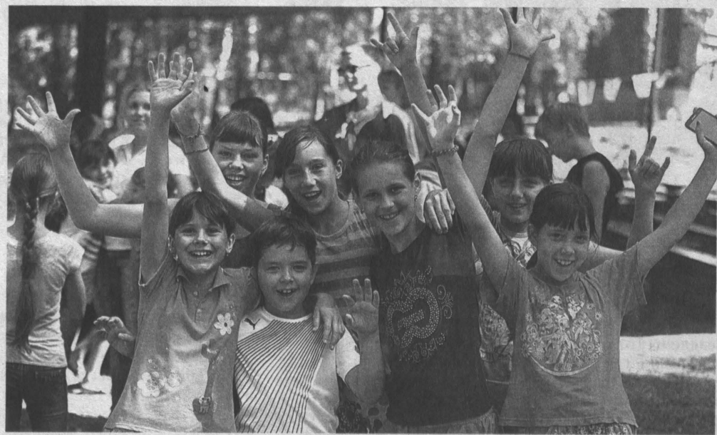
«Нам здесь нравится!» – это общее настроение отдыхающих в «Дельфине».

Где-то у самого горизонта сливаются краски моря и неба... И кажется, что белостольные березы – украшение детского оздоровительного лагеря «Дельфин» – нарисованы талантливой кистью на сплошном сине-лазуревом фоне, просвечивающем сквозь листву. Впрочем, здесь много чем можно залобоваться: например, шустро снуют у самого берега толстолобики; кружат над водной гладью бело-снежные чайки; а по вечерам нарушают тишину совы, которые давно облюбовали эти места.