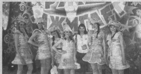
Недровые кружева «Любавушки» в Париже.