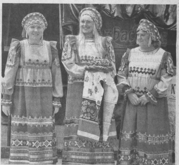
«Испекли мы каравай» – участники праздника, работники хлебозавода № 8, г. Междуреченск.

За три года персональными наградами и поощрениями отмечено 104 сотрудника предприятия, 29 сотрудников удостоены звания «Заслуженный работник предприятия». Этот список значительно пополнен фамилиями тех, чей труд отмечен в честь праздника «День предприятия». В целом благодарственными письмами с вручением денежных премий и ценных подарков (в том числе