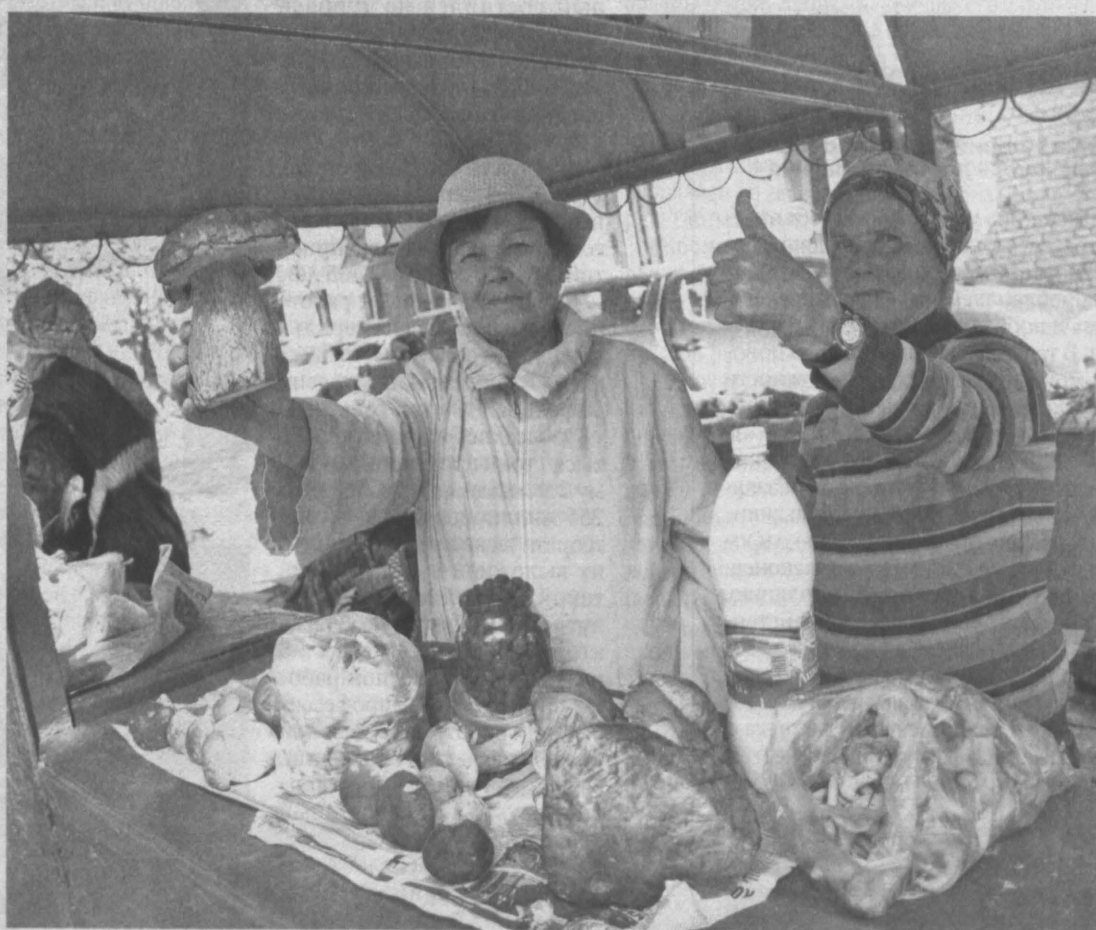
ЦАРЬ ГРИБОВ. Так называют белый гриб, который уже начали собирать на юге области, в частности, в Таштагольском районе. Он считается царем грибов не только из-за его внушительных размеров (шляпка может достигать 50 см в диаметре и ножка 25 см в высоту), но и благодаря вкусу и питательности. При правильном приготовлении это настоящий деликатес.