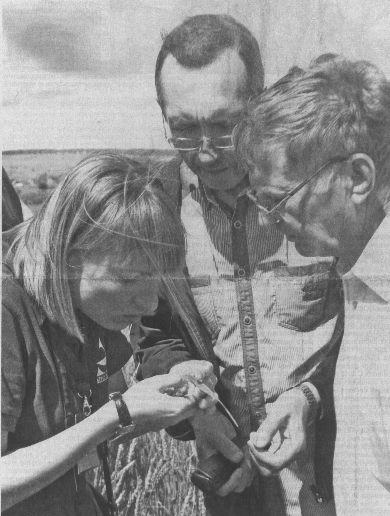
В поисках вредителя — пшеничного трипса.

О чем говорят в поле, в зале и за столом кузбасские фермеры?