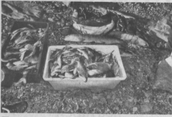
Во время рейда по пресечению незаконного вылова водных биоресурсов попались браконьеры.