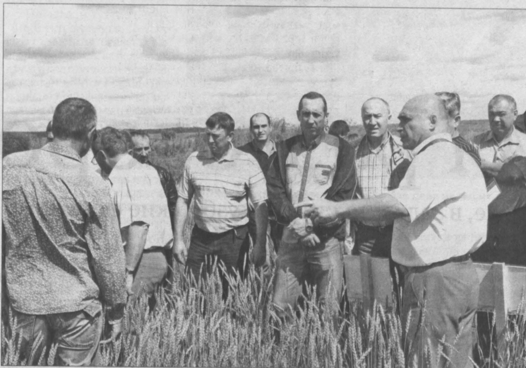
На экспериментальном поле.