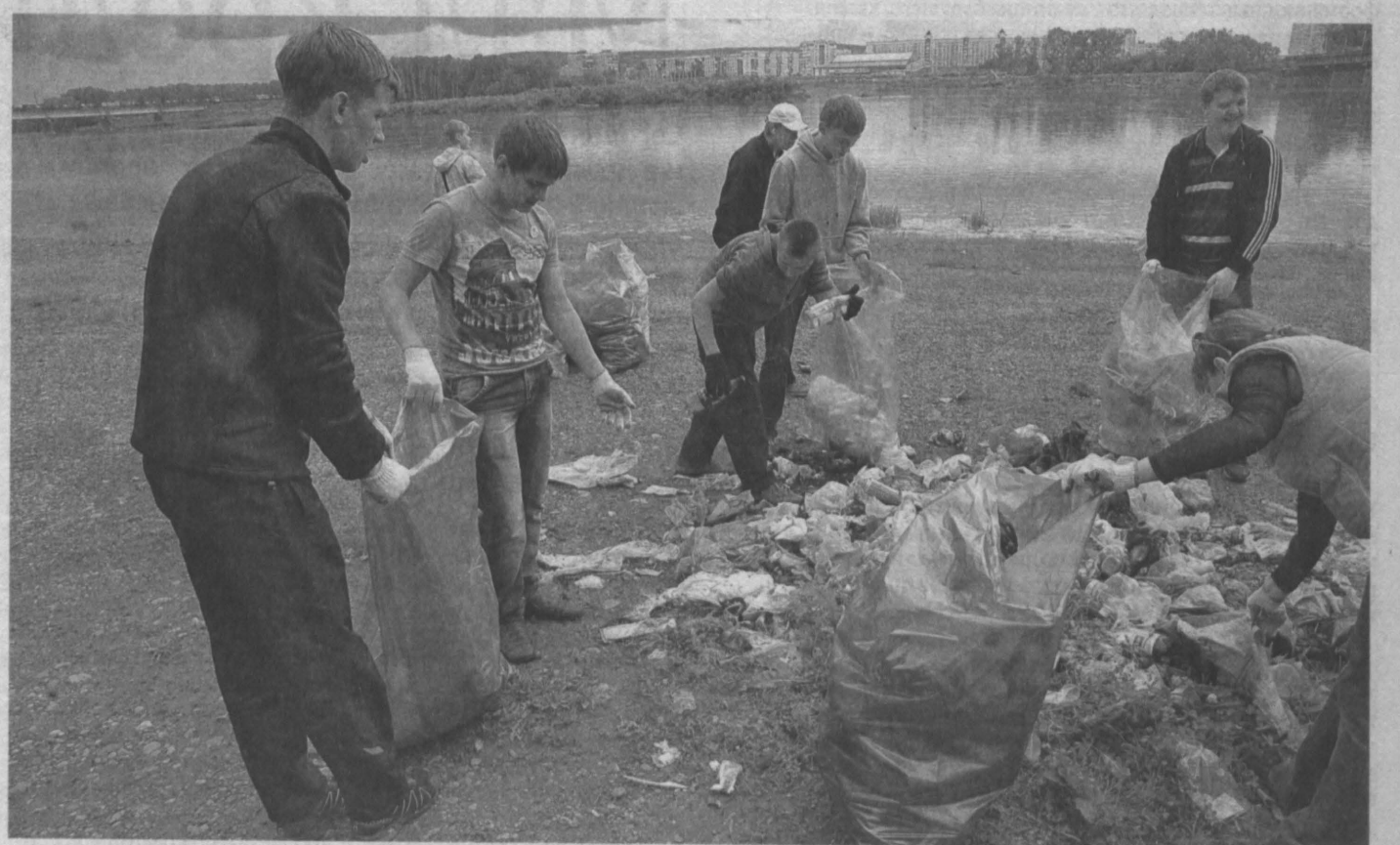
ЧИСТЫЕ БЕРЕГА. В Новокузнецке, в уникальном реликтовом месте под названием Топольники, где растет черный тополь - осокор, прошла экологическая акция «Наши реки и озера - чистые берега». Волонтеры, в числе которых были представители Совета молодежи Кузнецкого района, строительных и педагогических отрядов города, навести порядок в излюбленном месте отдыха горожан на берегу Томи. Сбор отходов - стекла, пластика и бумаги - производился раздельно. Завод «Эко-Лэнд» забрал ТБО на переработку. Акция проводилась в рамках Всемирной уборки «Сделаем! - 2014».