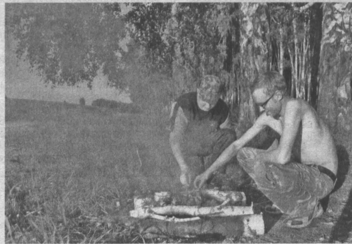
С друзьями всегда весело!

Стояли теплые денки конца августа, всё располагало к тому, чтобы выехать за город. Провести выходные не дома и не на даче, а сидя с удочкой возле водоема. При этом мы с друзьями определились сразу: поскольку у нас очень хорошие места кругом, далеко не поедем. А ответственным за весь этот парад пришлось стать мне. У многих не было транспорта, и решено было ехать на моей «Ниве».