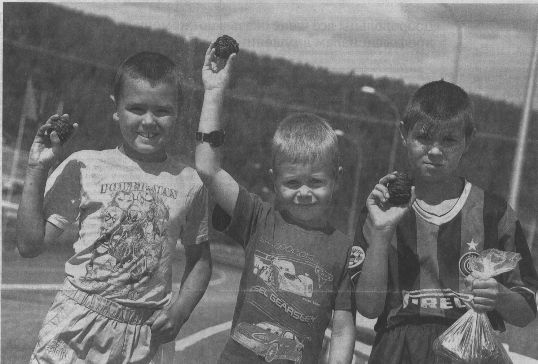
За слишком ранний сбор шишек особенно нетерпеливым охотникам за лесными трофеями может достаться на орехи!

В Кузбассе официально установлен срок начала заготовки кедрового ореха на территории области. В этом году разрешенный «шишкой» начнется 20 августа