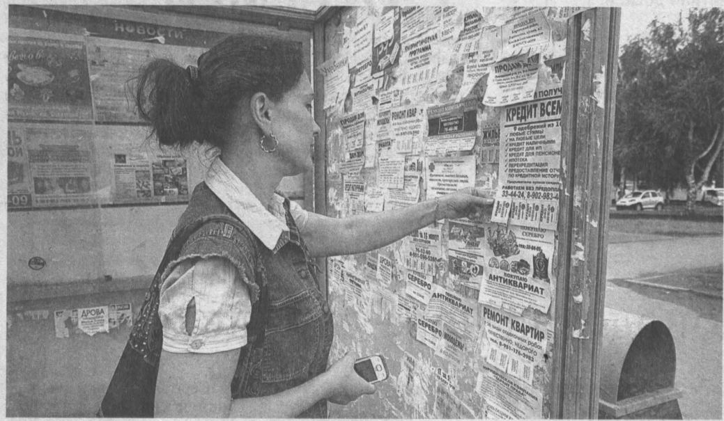
Таними легко доступными, как сейчас, микрозаймы, наверное, еще не были никогда.

Особенность МФО заключается в том, что они выдают небольшие средства, например, пять тысяч рублей, на небольшой период времени, допустим, семь дней. За каждый день такая организация берет 2%, это приблизительно 100 рублей в день. Казалось бы, небольшая сумма. Но если под-