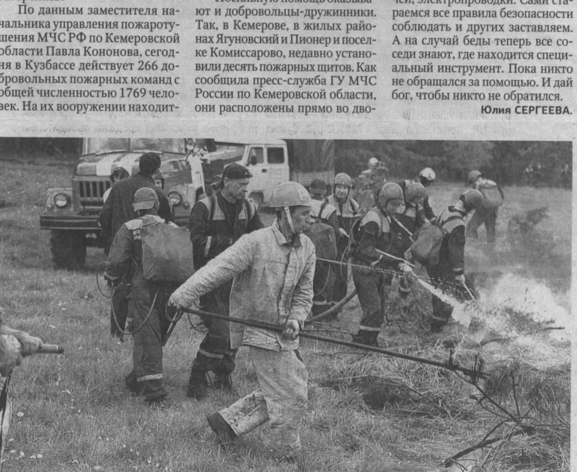
Добровольцы зачастую оказываются самой эффективной группой «немедленного реагирования».