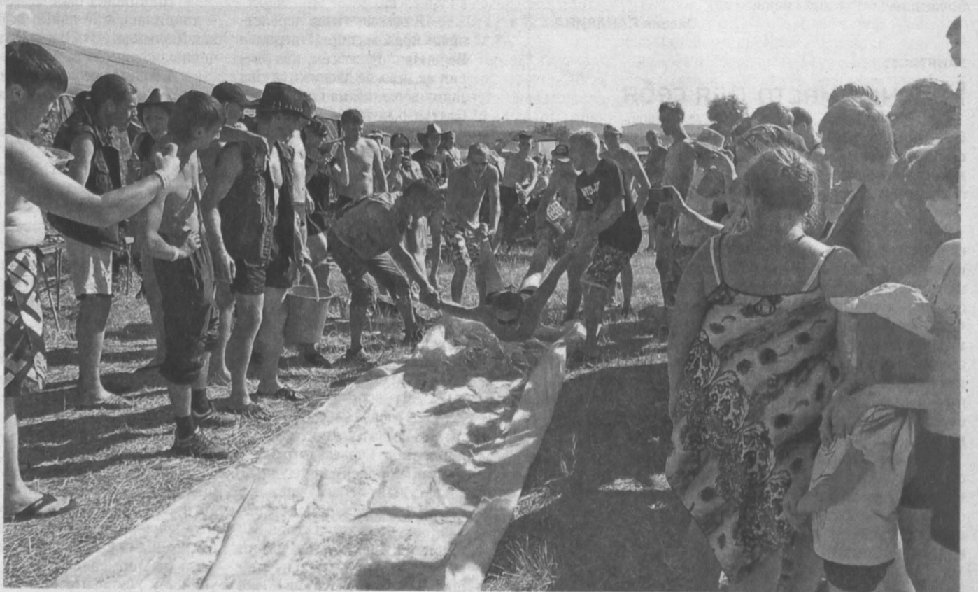
ПО КОЛЬЦОВОЙ ДОРОЖКЕ. Отдыхающие на берегу озера Танай Промышленновского района организовали летние забавы. Самым необычным стало испытание «кольцовая дорожка». На 30-метровую пленку налили моющее средство. Четыре человека расклевывали плато и отпущали его вперед. На каждом отрезке пути стояли призы — разные прохладительные напитки. До какого подарка смельчак «доскальзывал», тот и забирал. Кстати, были и такие «слетуньи», которые преодолевали всю дистанцию.