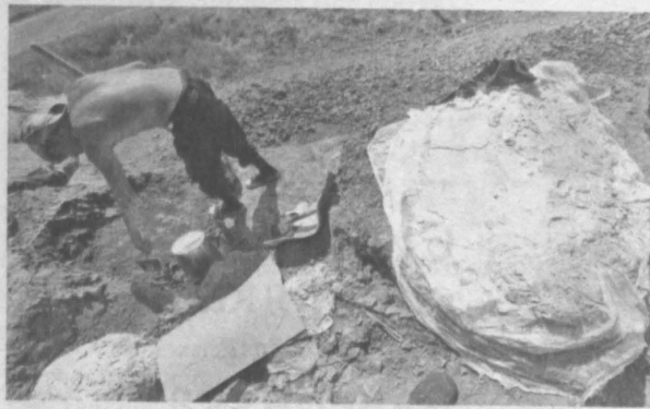
Раскопки на Шестаковском палеонтологическом комплексе продолжаются.