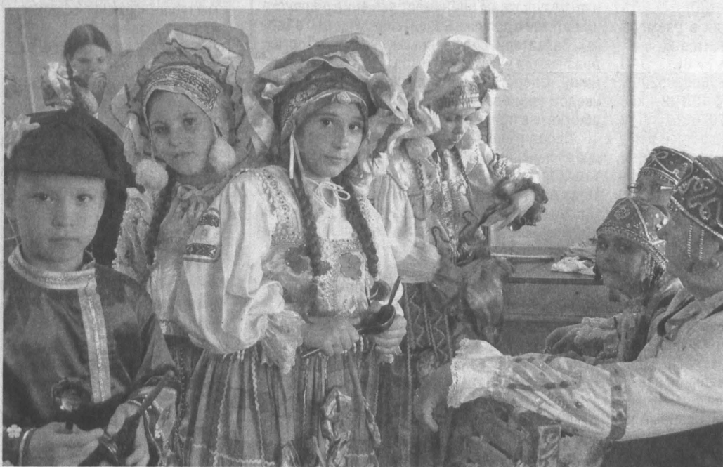
«Сибирский тусесок» перед концертом.