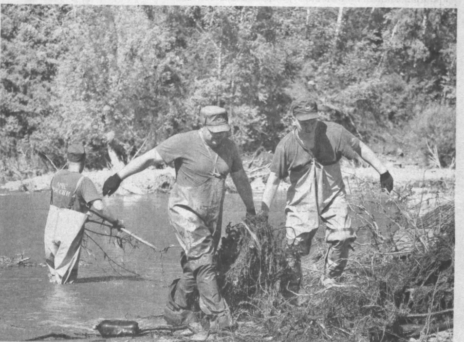
Вести восстановительные работы нашим спасателям порой приходилось по пояс в воде.