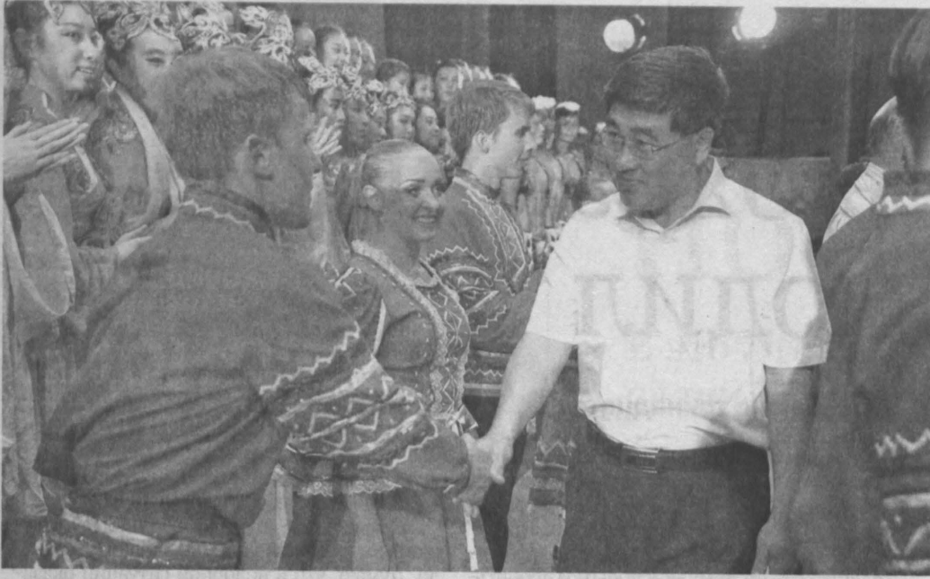
Во время визита ансамбль русского танца «Молодой Кузбасс» принял участие в церемонии открытия фестиваля искусств.