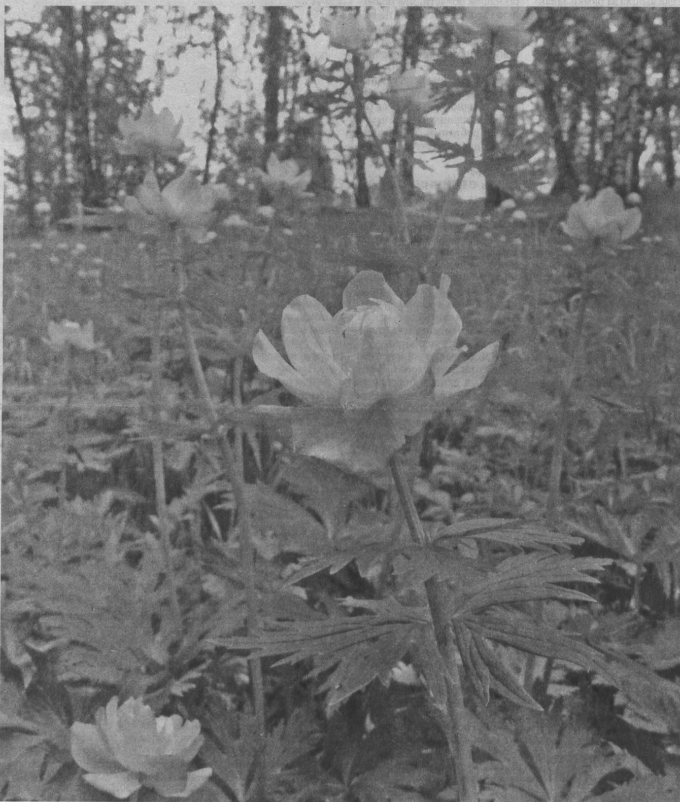
Наш огонек достоин места в «Аллее России»!

В Кемеровской области выбирают зеленый символ нашего региона. Растение, которое «победит», будет представлять Кузбасс в новом природно-патриотическом парке «Аллея России» в Крыму