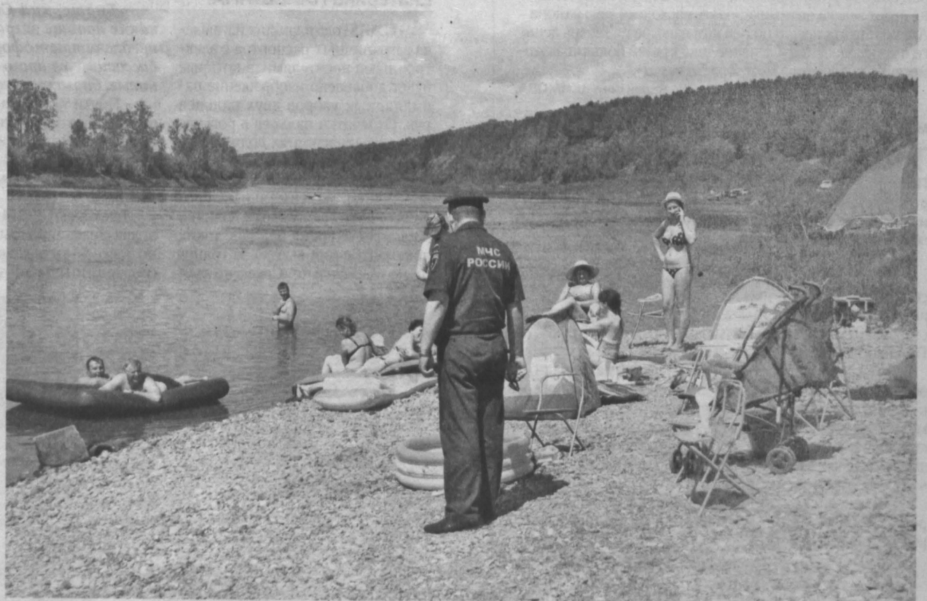
ОТДЫХ ПОД КОНТРОЛЕМ. 20 пляжей и 5 мест отдыха у воды уже открылись в Кузбассе — это по данным на вчерашний день. Для обеспечения безопасности сотрудники МЧС патрулируют пляжи, и особое внимание уделяется несанкционированным местам отдыха, где не дежурят спасатели, не оборудованы для купания дно и берег. Также в ходе патрулирования проводятся разъяснительные беседы с отдыхающими о правилах безопасного поведения у воды и на воде, распространяются листовки и памятки.