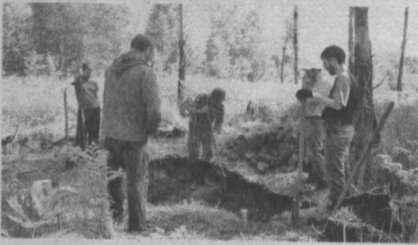
В экспедиции участвовали и прихожане Новокузнецкого храма святых равноапостольных Кирилла и Мефодия.