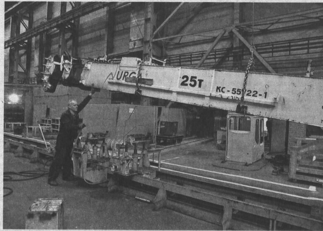
«Газпром межрегионгаз Кемерово» ограничил поставку газа «Юргинскому машиностроительному заводу» еще в мае прошлого года.

«Газпром межрегионгаз Кемерово» ограничил поставку газа «Юргинскому машиностроительному заводу» еще в мае прошлого года. Газопотребляющее оборудование должника перевели в режим экономного потребления, что сократило объем поставляемого за сутки газа почти втрое. Но режим поставки систематически нарушался. Проконтролировать газопотребление поставщик не мог — его представителей не пропустили на территорию ЮМЗ. Компания вынужде-