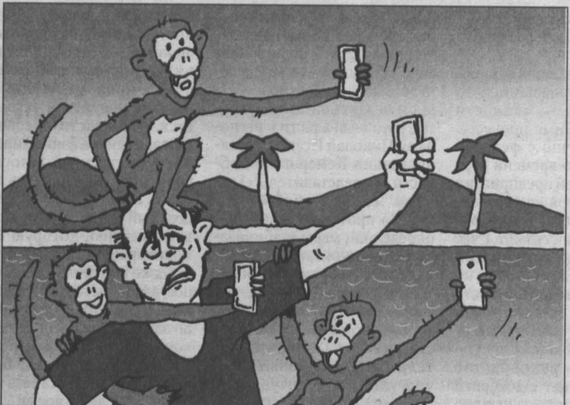
Рисунок Андрея Горшкова.