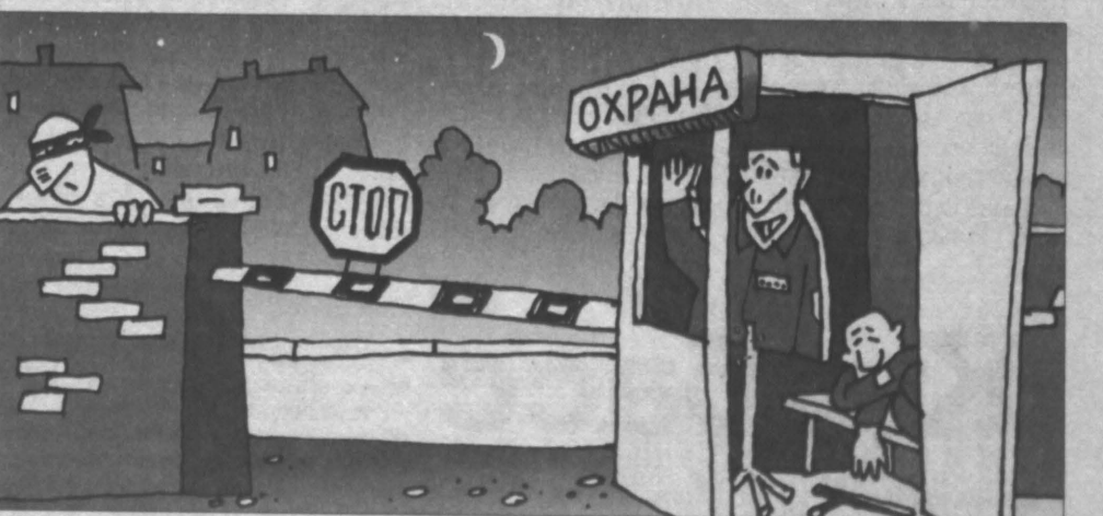
Рисунок Андрея Горшкова.

Выходит, есть смысл бороться с недобросовестными работодателями. Евгений ПЕТРОВ.