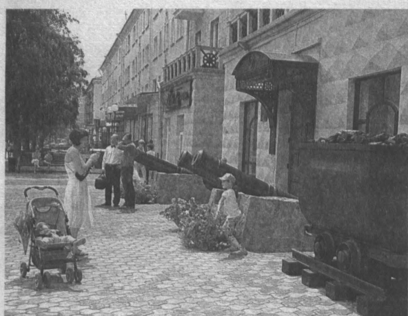
Новокузнецкий краеведческий музей – один из крупнейших и старейших музеев области – открылся после реконструкции.