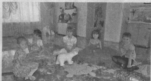
Детсадовцы осваивают новый 3D – пол.