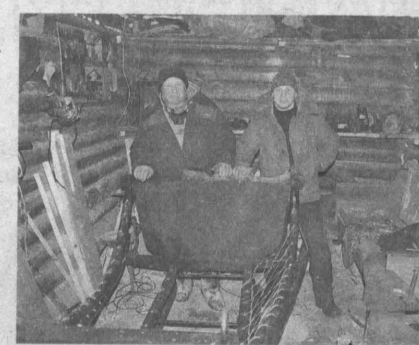
Готовы сани зимой!