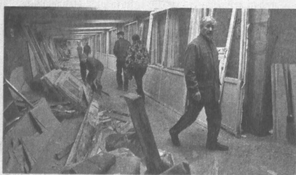
Трудности для пешеходов временные. Зато скоро подземки будет не узнать.