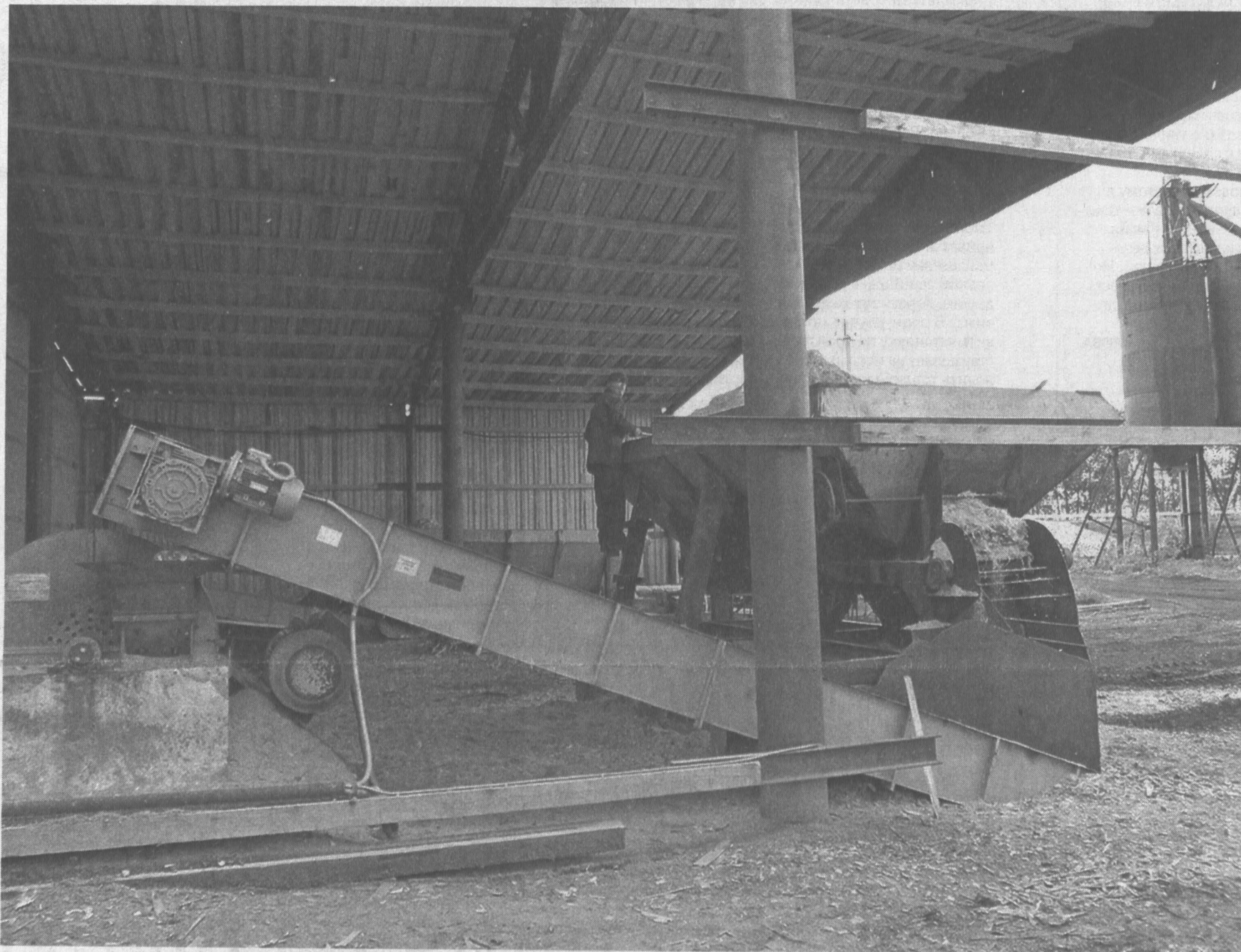
ООО «Таежный», линия по производству пеллет.

Лесная отрасль Кузбасса, как и всей страны, стоит сегодня перед вопросом создания предприятий переработки низкосортной древесины, не востребованной большой экономикой