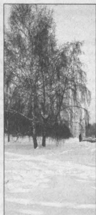
Прогноз предоставлен Кемеровским гидрометеорологическим центром.

Общий уровень загрязнения атмосферы ожидается невысокий.