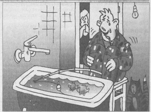
Рис. Андрея Горшкова.

Василий: «Мы, очень большое количество рыболовов-любителей, не можем понять разумом, что такое бывает. В д. Чесноки находится старый водоём, проточный, раньше разводили карпа, впоследствии развалился колхоз. Дамба была хорошая, с шандорами и рыбоборником. В 2009 г. ГО и ЧС за счёт региона убрали рыбоборник, заменили шандоры и усилили дамбу. Большое денежное вложение, около 9 млн. руб. И поставили на баланс в районную администрацию заградительное сооружение и водоём для ЧП. В 2013 г. весной появляется хозяин, ставит будку, и начался удочка 300 руб., спиннинг 400 руб. За что? Бодоём зарыбленный, попадаете лещ, амур, толстолоб, карп, мурло окуня, щуки и очень много крупного гибридного карася. Водоём сильно заросший, подходов нет, только дамба, а так только на лодке, потому что от берега до воды 20 м болото. И выдут сборщики денег говорят: мы карпа будем запускать (профанация). А райисполком ничего не знает про аренду, и на каком основании... Единственный пруд, где можно было отдохнуть и поймать 3-5 кг хорошего карася, окуня, щуки на удочку и спиннинг, а новые хозяева сейчас за запрет приглашают друзей с сетями, показывая: мы тут слава. Помогите разобраться с беспределом как можно быстрее, пока хозяева не успели последние радости. Из нашего наблюдения, сколько прудов им попола, все стинуло и брошено (ни рыбы, ни рыбаков). Очень ждём ответ. С уважением записанные в угол и облезлые, но законопослушные рыбаки».