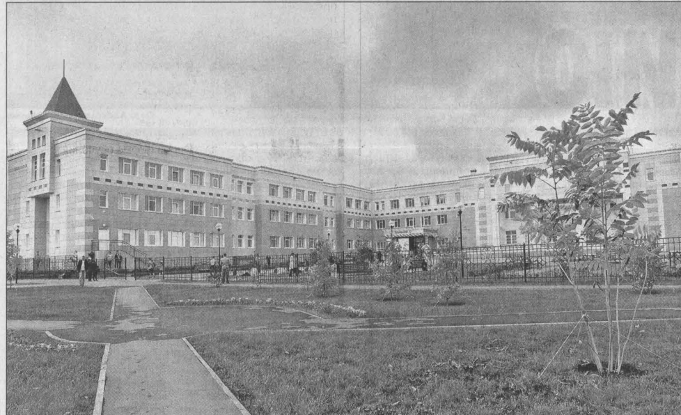
Гимназия №42 в Лесной Поляне.