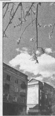
Прогноз предоставлен Кемеровским гидрометеоцентром.

Общий уровень загрязнения атмосферы ожидается невысокий.