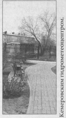
Прогноз предоставлен Кемеровским гидрометеорологическим центром.

21 апреля Переменная облачность, в отдельных районах небольшие дожди, ночью с морозом снегом, в горах лавиноопасно, ветер западный 2-7 м/с, местами порывы до 14 м/с.