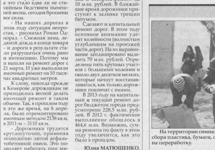
На территории гимназии №41 г. Кемерово поставили четыре бака для раздельного сбора пластика, бумаги, стекла и металла. Отходы, которые в них попадают, пойдут на переработку.

цифра 250 тысяч кузбассовцев вышли вчера на уборку улиц, парков и скверов.