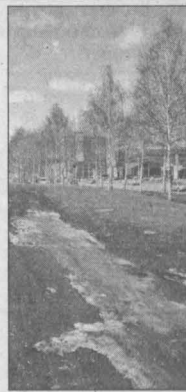
Прогноз предоставлен Кемеровским гидрометеосцентром.

Общий уровень загрязнения атмосферы ожидается невысокий.