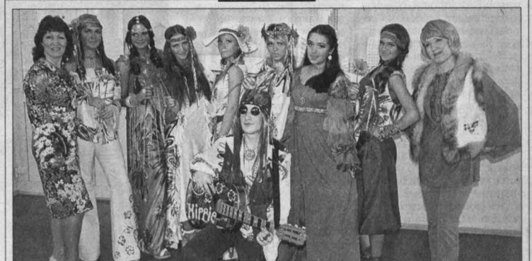
Объединенный творческий коллектив театра моды «Вдохновение» школ №1 и 2 Топок принял участие во II Лиге областного конкурса детских театров моды, школ и студий костюма «Подium-2013». Коллекция «Дети цветов» в стиле хиппи стала лучшей в номинации «Современный молодежный костюм».