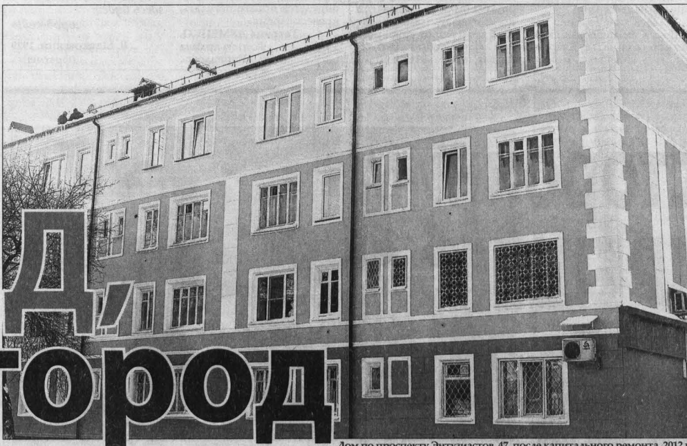
Дом по проспекту Энтузиастов, 47, после капитального ремонта, 2012 г.