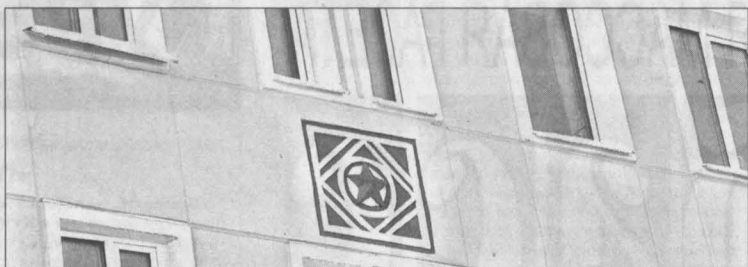
Один из элементов декора соцгорода, восстановленный в 2011 г.

Татьяна ДУМЕНКО.