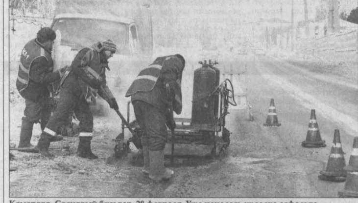
Кемерово, Сосновый бульвар, 28 февраля. Уже началась укладка асфальта.