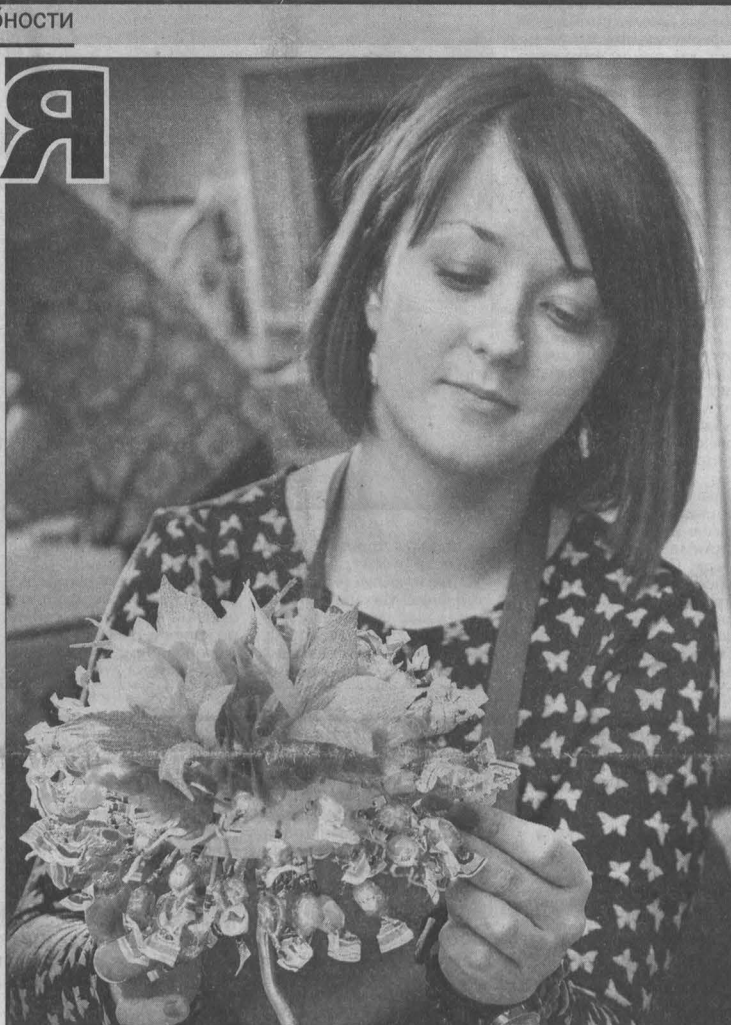
Девушки, которые работают в фирме Галины Чубуковой, создают атрибуты праздника.