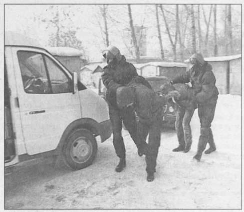
В крупномасштабной спецоперации по захвату «кузнечкостроевских» в феврале 2012 года участвовали более ста сотрудников полиции при силовой поддержке бойцов СОБРА и ОМОНа.

В качестве обвиняемых по данному уголовному делу проходит 12 человек, все они находятся под арестом, – рассказал сотрудник пресс-служ-