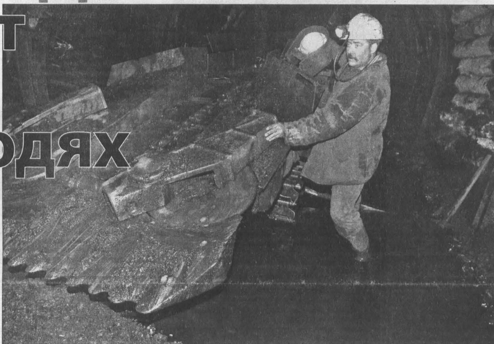
Шахтерский труд во всем мире признан опасным. Но без него не обойтись...

По новому порядку, который вступит в силу с нового года, все вредные и опасные рабочие места станут оценивать на предмет соответствия вредности для здоровья. Это обстоятельство волнует потенциальных льготников: а не потеряют ли они право на досрочную пенсию и другие привилегии, на которые рассчитывали?