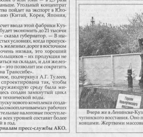
Вчера же в Ленинске-Кузнецком губернатор открыл мемориал героям и жертвам Колычугинского восстания. Оно произошло в марте 1919 года и было жестоко подавлено колючковцами. Жертвами массовых расправ стали более 600 человек.