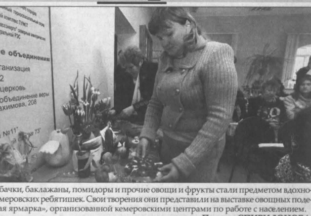
Тыква, кабачки, баклажаны, помидоры и прочие овощи и фрукты стали предметом вдохновения для кемеровских ребятишек. Свои творения они представили на выставке овощных поделок «Овощная ярмарка», организованной кемеровскими центрами по работе с населением. Полина СПИРИДОНОВА.