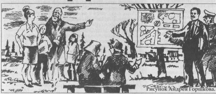
Рисунок Андрея Горшкова.

А вот послание «в Президиум Верховного Совета СССР от граждан г. Осинники Кемеровской области» (так и озаглавлено): «Мы решили к Вам обратиться, – писали авторы документа, – от имени многих граждан нашего города. Управление нашего города, горисполком решили строить городской парк отды-