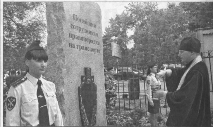
Открытие памятника сотрудникам Дальневосточной транспортной полиции, погибшим при исполнении служебного долга.

4. «Шахтер» (Прокопьевск) - 16 (8). 5. «Сибирь-2М» (Новосибирск) - 12 (9). 6. «Поллимер» (Барнаул) - 12 (8). 7. «Динамо» (Барнаул) - 9 (7). 8. «Динамо» (Бийск) - 6 (4). 9. «Селенга» (Улан-Удэ) - 6 (6). 10. «Чита-М» (Чита) - 6 (9). 11. «Рассвет» (Красноярск) - 1 (6). 12. «Торпедо» (Рубцовск) - 0 (7).