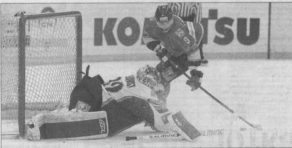
ХОККЕЙ С ШАЙБОЙ