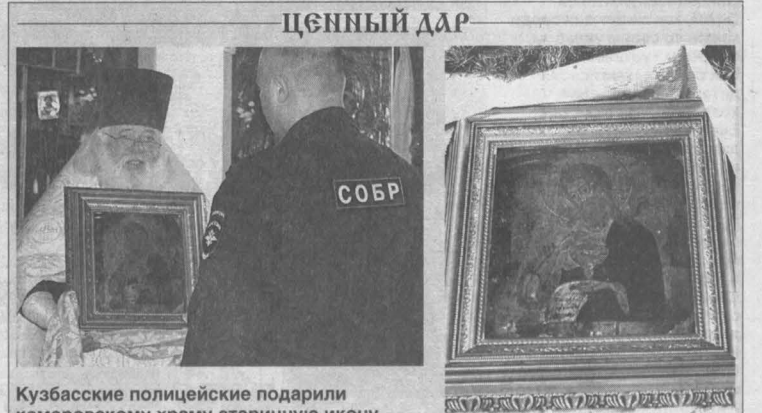
Кузбасские полицейские подарили Кемеровскому храму старинную икону, спасенную в ходе боевых действий на Кавказе.

По окончании Божественной литургии кузбасский архипастырь совершил чин великого освящения воды.