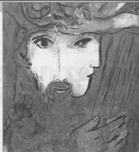
Давид и Вирсавия.