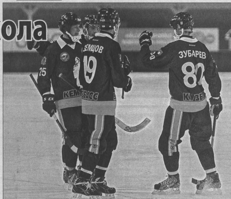
Швеция, Эдсбюн.

Вадим АНТОНОВ. НА СНИМКЕ: хоккеисты «Кузбасса» попрощались со Швецией на мажорной ноте.