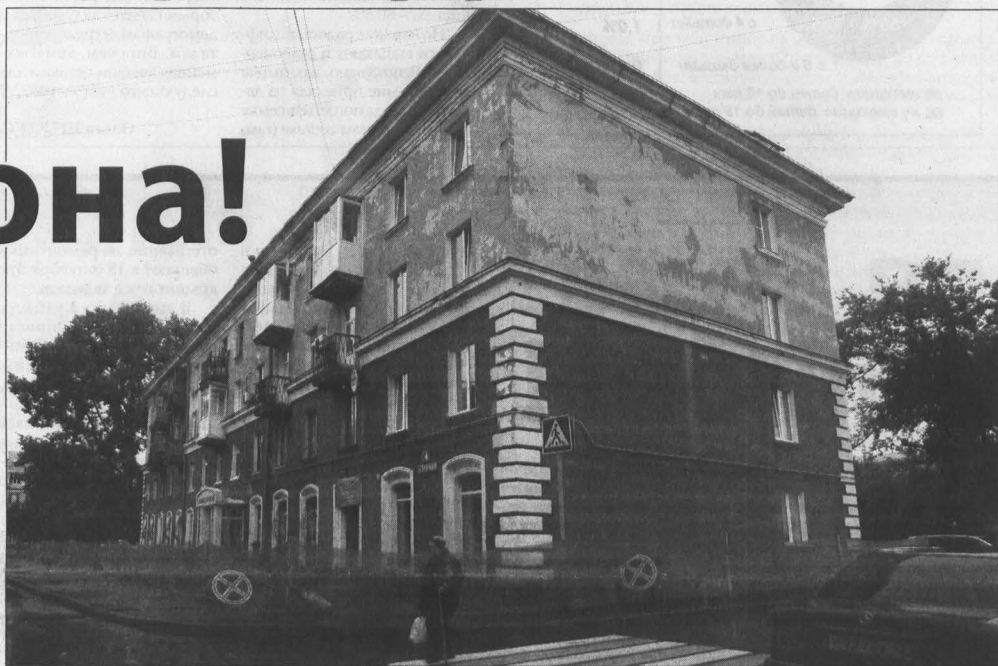
Этому дому на Арочной повезло попасть в программу капремонта.

В доме потекла крыша. Жильцы верхних этажей не знают: обращаться то ли сначала в РЭУ, то ли сразу – в администрацию города, области. А кто-то, ни на кого не надеясь, начинает интересоваться, сколько сегодня стоит один квадратный метр ремонта кровли.