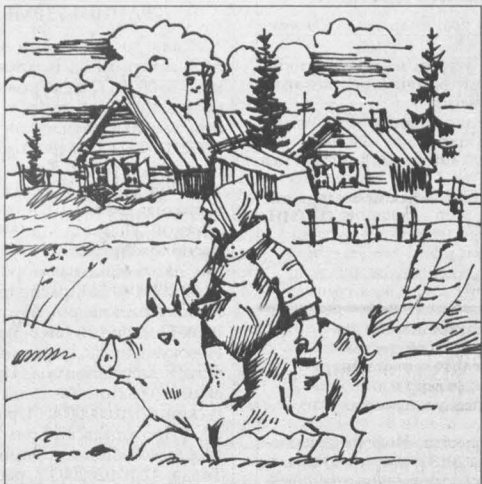
Рис. Андрея Горшкова.

С раннего детства и поныне я очень люблю всех животных. И когда им плохо, стараюсь помочь чем могу. Знаю столько веселых и грустных историй о них, что можно написать целую книгу.