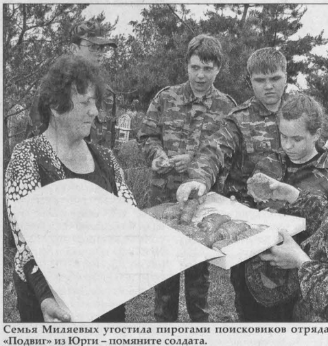
Семья Милаевых угостила пирогами поисковиков отряда «Подвиг» из Юрги — помяните солдата.