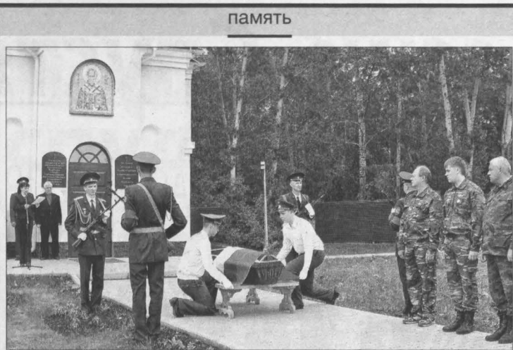
На траурном митинге совершается ритуал свертывания Государственного флага.