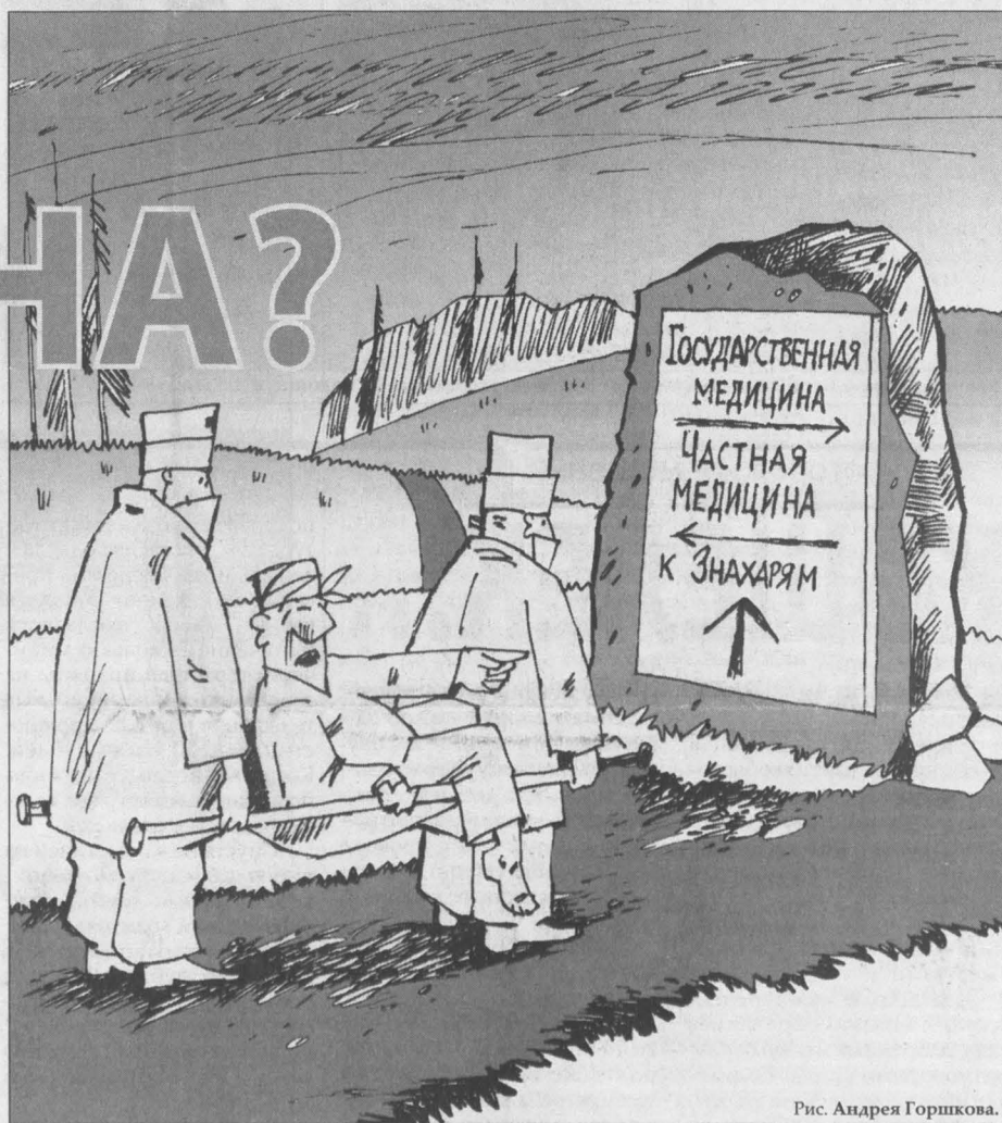
Рис. Андрея Горшкова.

Вряд ли можно считать совпадением тот факт, что после старта программы модернизации в Кузбассе появились сразу два коллегияльных органа «частников»: региональное отделение Общероссийской ассоциации врачей частной практики (в масштабах страны существующей