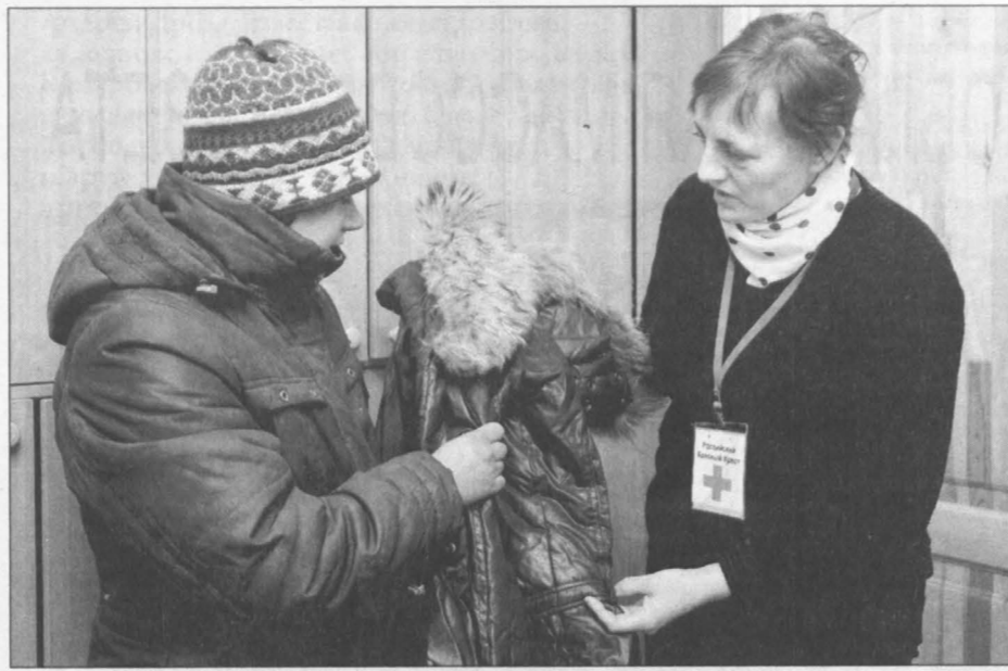
Красный Крест и оденет, и накормит.

В Новокузнецке единственное место, где бездомные могут найти крышу над головой, – муниципальное казенное учреждение «Дом ночного пребывания для лиц без определенного места жительства и занятий». С наступлением морозов оно перешло