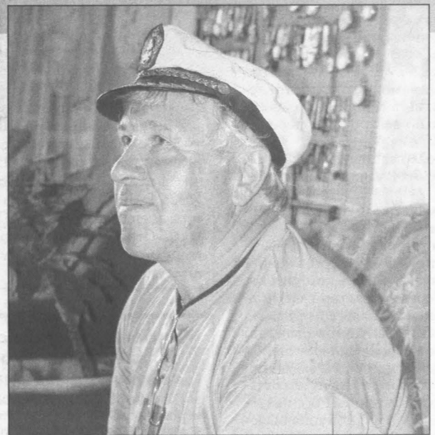
Под колокольный перезвон.

механические и отличаются друг от друга корпусами, размерами, модификацией. А еще есть настольные часы, карманные и будильники. «А вот настольных – ни одного». Пообещает кто-нибудь, а потом обязательно не получится». Среди особых раритетов – большие настенные французские часы 19-го века, несколько лет назад выкупленные у пожилой женщины, переселенки из Казахстана. Еле уговорил ее продать эту семейную реликвию. Есть в коллекции и два трофея военных лет. Карманные часы «Молния» ручной работы 50-х годов – на цепочке, с секундной стрелкой, изображением Сталина и знаменитой надписью: «Наше дело правое. Мы победили». И военный трофей с изысканной гравировкой тонкой работы: «Это швейцарские часы, мне их одна женщина отдала, вместе работали. Отец ее с фронта