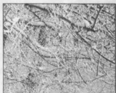
Прогноз предоставлен Кемеровским гидрометеорологическим центром.

Общий уровень загрязнения атмосферы ожидается невысокий.