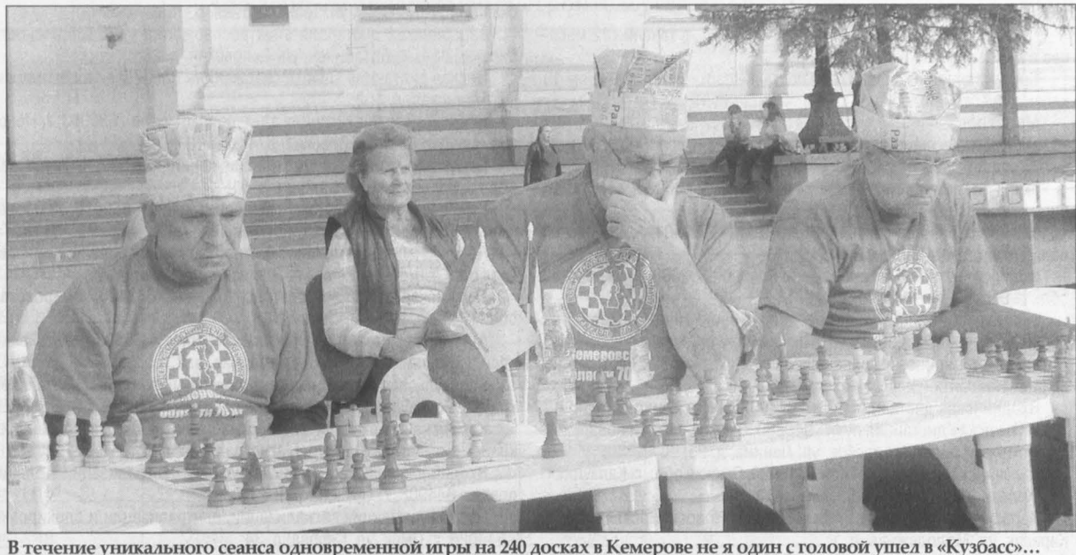
В течение уникального сеанса одновременной игры на 240 досках в Кемерове не я один с головой ушел в «Кузбасс»...