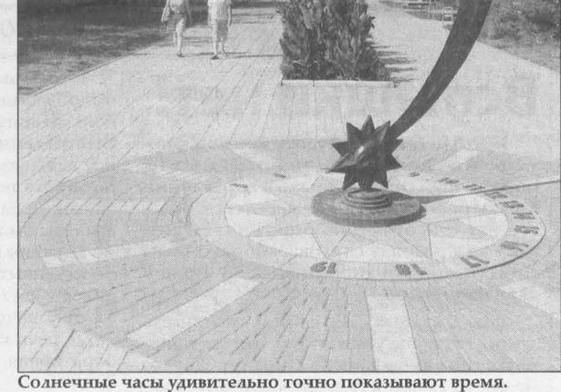
Солнечные часы удивительно точно показывают время.

Еще два года назад улица, идущая от пляжа, была провинциально-обыкновенной. Размороженные отдыхающие шлепали усталое с купания по разрастающему асфальту, стараясь забиться в тень редких стеленых деревьев. А тут просто настоящий променад появился. Выложенный плит-