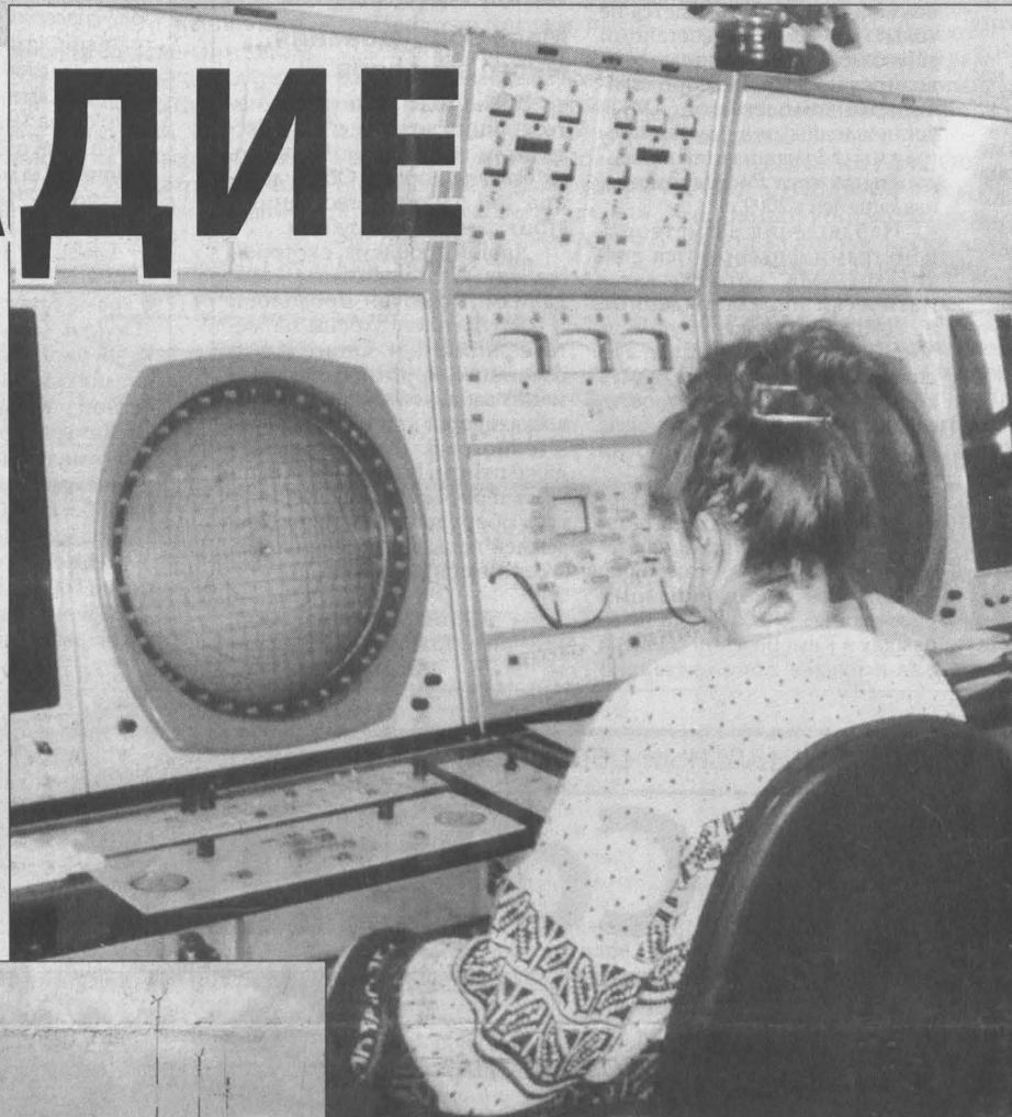
Метеолокатор в Кемеровском аэропорту «видит» погоду всего на 200 км.

Когда-то в Новокузнецке была большая метеослужба, круглосуточно работали синоптики-прогнозисты, пользовались данными, полученными с помощью метеозондов, которые запускали в Новосибирске и Барнауле, составляли графики, делали долгосрочные и краткосрочные прогнозы, рассылали их по предприятиям и организациям города, в СМИ, с которыми имели договоры. Теперь в Новокузнецкой гидрометеобсерватории трудятся всего три синоптика в