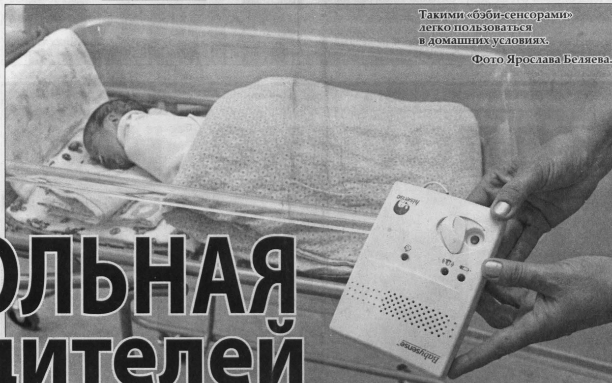
Таковыми «бэби-сенсорами» легко пользоваться в домашних условиях.

В Новокузнецке стартовал уникальный для Кузбасса эксперимент по контролю за состоянием глубоко недоношенных детей в домашних условиях. На покупку специальных приборов, с помощью которых родители смогут следить за самочувствием своих малышей, администрация города выделила 1,4 миллиона рублей. Первый договор безвозмездной аренды такого оборудования будет заключен между городской детской клинической больницей № 4 и родителями выписываемого малыша буквально со дня на день.