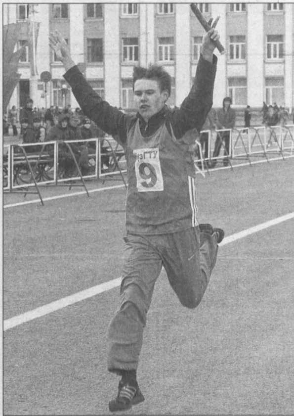
Победный финиш «политеховцев».

забегах. Прошли времена, когда факультет физкультуры и спорта выковывал одну победу госуниверситета за другой. Вот и на этот раз легкоатлеты КузГТУ оказались быстрее своих коллег из КемГУ. Причем если в забеге мужских команд гуманитарии отстали на безнадлежащих девять секунд, то поражение в «микроматче» среди сборных вузов выиграл донецкий обидник: «универовцы» упустили победу на последнем этапе, уступив в итоге всего лишь одну секунду. Однако и второе место КемГУ, как и вообще участие в эстафете всех 1312 бегунов из 82 команд можно считать большим достижением. Мало того, что в центре Кемерова столбик термометра показывал всего лишь четыре градуса тепла, так периодически с неба начинал падать самый натуральный снег. И при этом спортсмены выступили очень достойно. Например, сборная команда 48-й школы умудрилась показать время в 12 минут и 32 секунды, опередив в общей классификации некоторые старшие по возрасту команды. Если эти ребята потом поступят в крупнейшие кемеровские вузы, захватывающая интрига извечному городскому легкоатлетическому «дерби» обеспечена еще на многие годы.