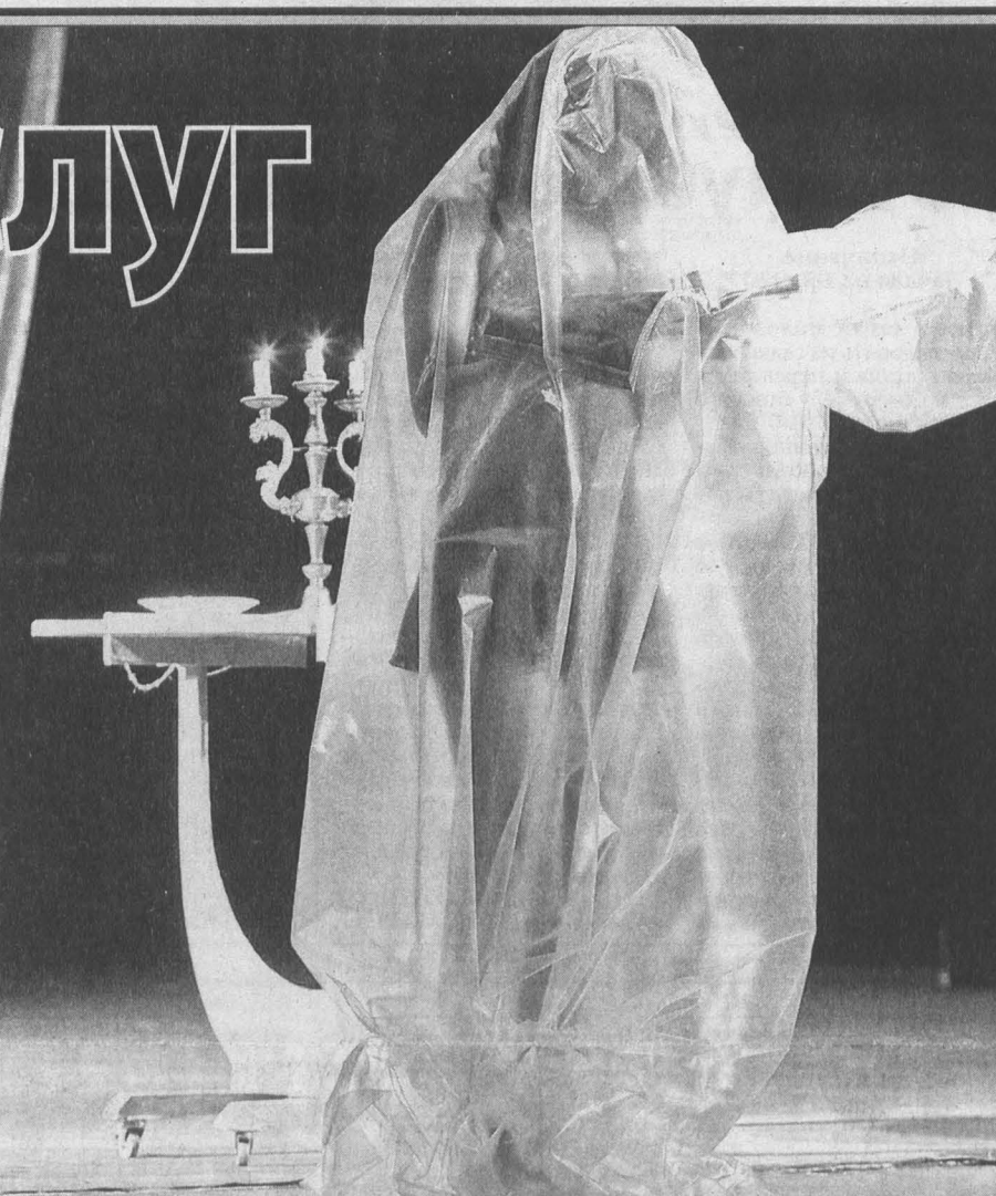
Сцена из спектакля «Целлофан».

В Беловском районе недавно новоселье справили сразу 30 тысяч мальков форели. Вылупились они из икры, закупленной в Адлере, и пока обживают ванны инкубатора местного рыбного хозяйства. Для молоди здесь круглосуточно поддерживают температурный режим в 15-16 градусов, обеспечивают свежей водой.