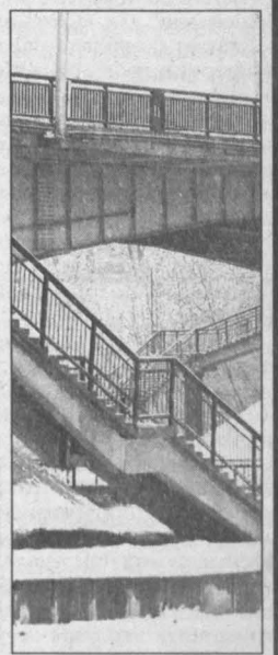
Прогноз предоставлен Кемеровским гидрометцентром.

Днем переменная облачность, дождь, местами грозы. Ветер восточный от слабого до умеренного. Давление будет падать, влажность существенно не изменится. Общий уровень загрязнения атмосферы ожидается невысокий.