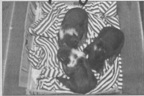
Будущие звезды манежа.