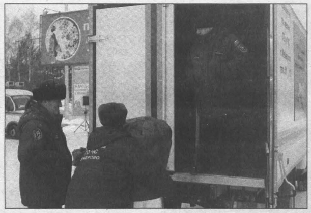
График работы передвижного пункта приема отработанных энергосберегающих ламп составлен так: в утренние часы спецавтомобиль будет находиться в местах движения кемеровчан к остановкам общественного транспорта, а в вечерние часы – в центрах микрорайонов и жилых комплексов.

Подробнее о точках курсирования спецавтомобилей можно узнать на официальном сайте www.кемерово.рф, в разделе «Энергосбережение».