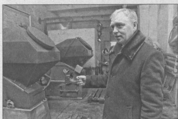
Новая техника себя уже показала.

На кемеровской котельной №34 ОАО «Теплоэнерго» реализуется уникальный энергосберегающий проект — там установлены три автоматических котла под названием «Карборбот».