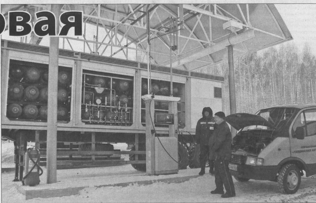
Этот заправочный комплекс обслуживает более 100 автомобилей.

Сегодня, год спустя как президент России Дмитрий Медведев дал старт добыче метана из угольных пластов на Талдинском месторождении, в Кузбассе зампреда правления ОАО «Газпром» Александр Ананенков и губернатор Аман Тулеев подводят первые итоги реализации программы развития первого метано-угольного промысла в России. Итоги эти впечатляют даже не цифрами инвестиций и масштабам уже проделанной работы. Теперь газ из угля в Кузбассе дает электричество в дома и заправляет автомобили.