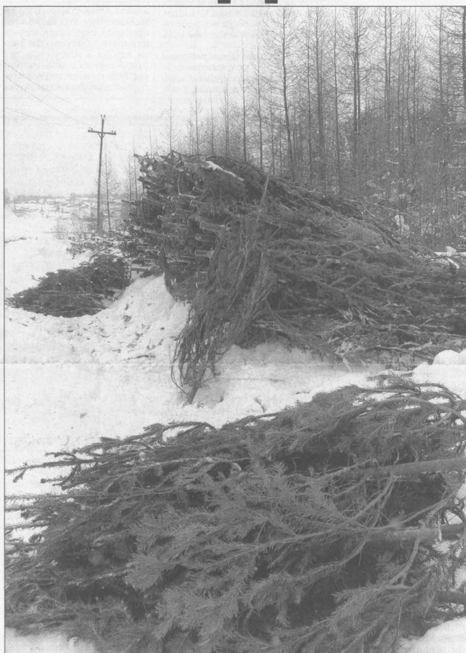
Браконьеры срубили эти елочки, а вот вывезти не успели.