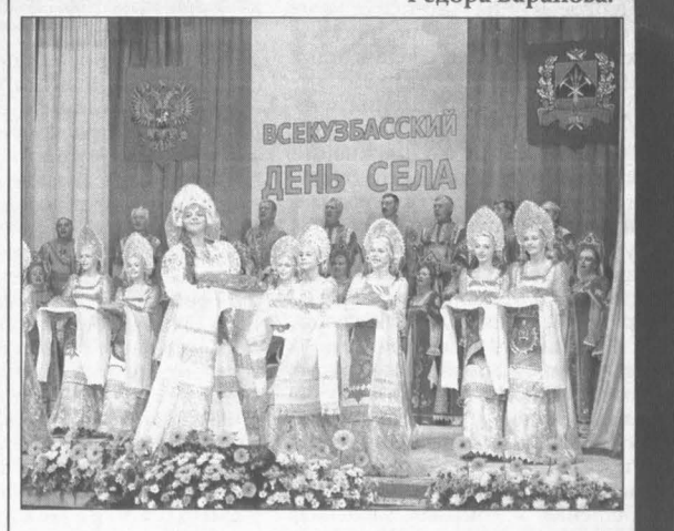
Фото Федора Баранова.

День села Гурьевск принял аграриев Гурьевский район стал пятым муниципалитетом области, где отмечается главный аграрный праздник региона (по аналогии с Днем шахтера и Днем железнодорожника). Ранее хозяевами праздника побывали Ижморский район (2007), Яйский (2008), Крапивинский (2009) и Чебудинский (2010). За год в Гурьевском районе построено, отремонтировано, приведено в порядок 29 социально значимых объектов. На подготовку района к торжествам направлено около 400 млн рублей, прежде всего, из областного бюджета. Фото Федора Баранова.