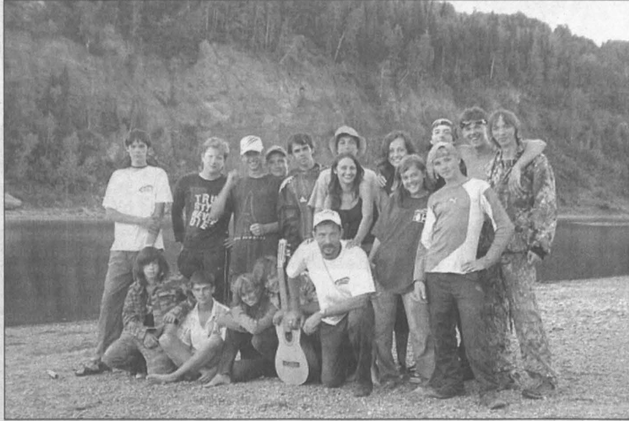
Уроки географии в полевых условиях.

А повышение зарплат учителей до уровня средних в экономике - 18655 р.