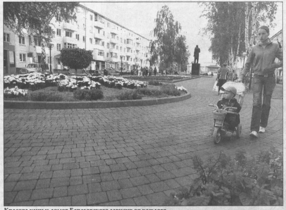
Красота улиц и домов Березовского зависит от каждого.

Галина БАБАНКОВА.