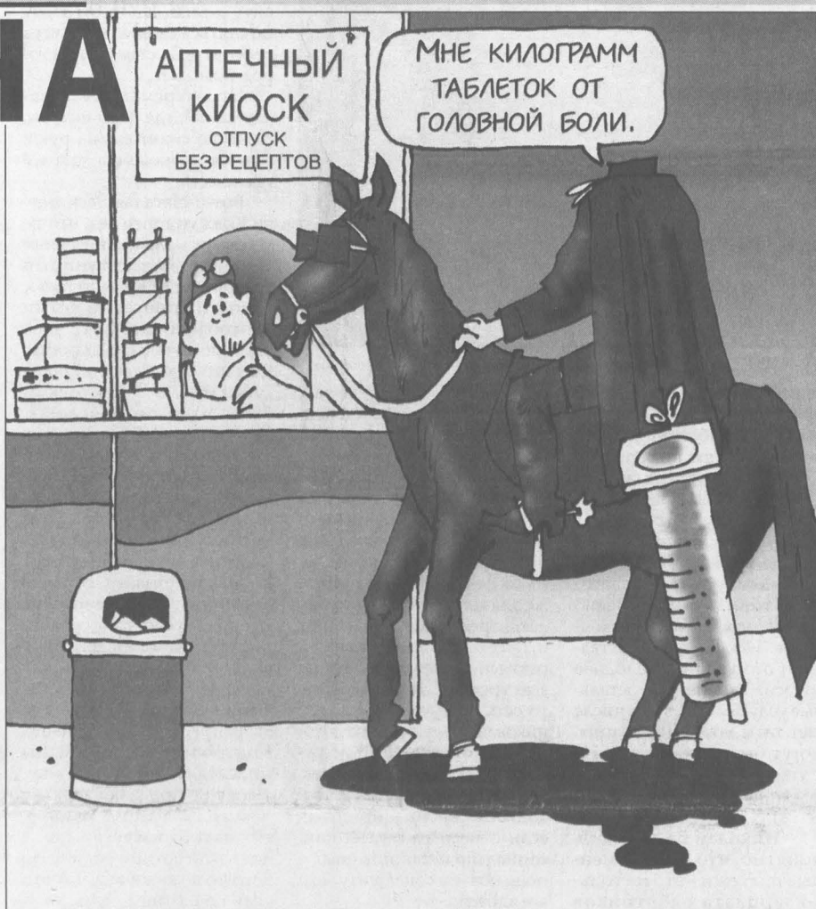
Рис. Андрея Горшкова.

Как врач скажу: безусловно, кодеинсодержащие препараты, имеющие сильное действие, необходимы для медицинского использования и в медицинской практике. Однако растущие объемы их продаж говорят о том, что ими явно злоупотребляют. Причем не всегда люди заблуждающиеся. Естественно, что пациенты, применяющие их по назначению врача, ни в коей мере не должны пострадать от таких ограничений. Кроме того, в настоящее время имеется очень широкий спектр аналогичных фармацевтических средств, в состав которых не входит кодеин, и в случае необходимости – например,