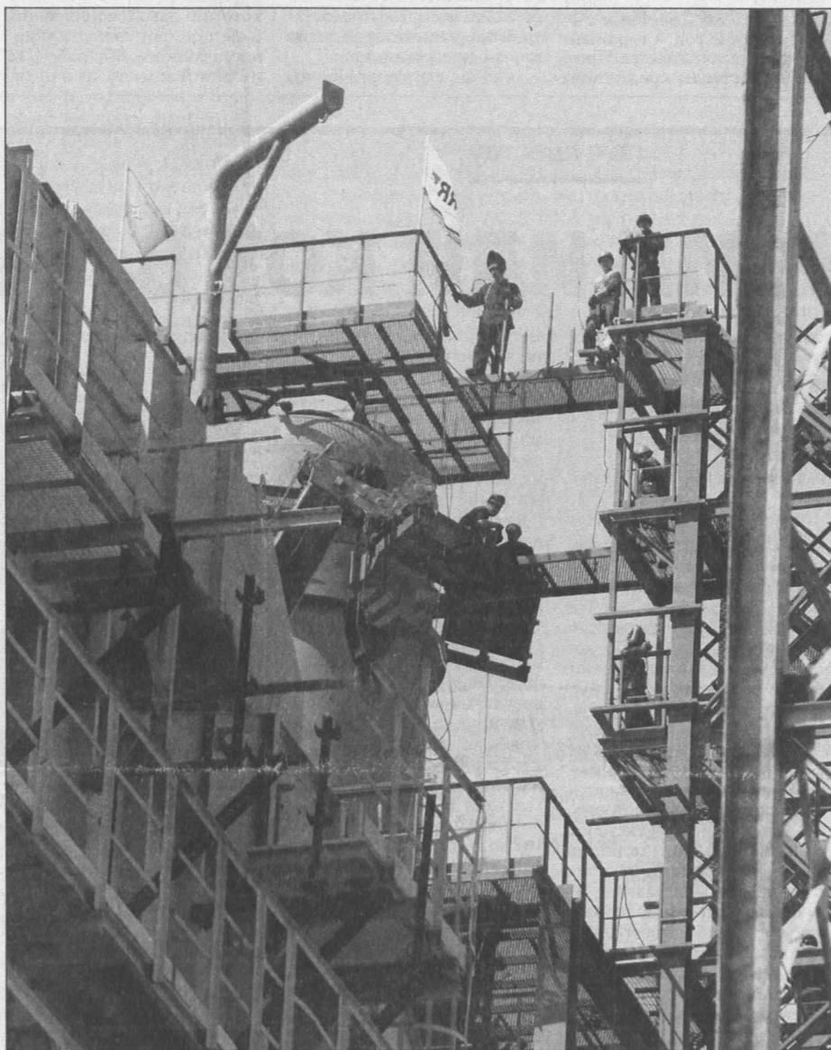
Эту 60-метровую колонну в Яю доставили специальным маршрутом из Волгограда. В городах перед ней снимали троллейбусные линии. Места зазоры под мостами были всего 5 см.