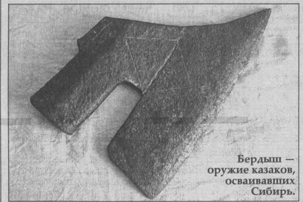
Бердыш - оружие казаков, осваивавших Сибирь.

В концертном зале Дворца молодежи в Кемерове прошёл рок-концерт с говорящим названием: «Rock for Life» (рок ради жизни) в поддержку здорового образа жизни. Прийти на концерт мог каждый желающий, так как вход был свободный. Идею проведения мероприятия предложило молодёжное объединение «Отражение» (при фонде «Кузбасс против наркотиков»), организатором стал Дворец молодёжи.