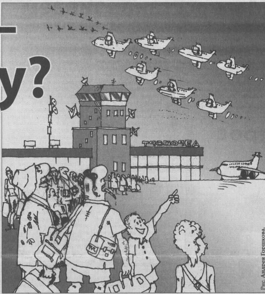
Рис. Андрея Горшкова.

кого и Красноярского краев. Ну прямо не Кемерово, а «Нью-Васюки» туристического мира. Любопытно, что спрос на внутренние авиарейсы по сравнению с прошлым годом хоть и подрос, однако до уровня 2008-го все равно не поднялся (смотрите таблицу 1). Прологодный рост вылетов за границу из города Кемерово еще можно было отнести на счет передела внутреннего туристического рынка: люди бывалые, летавшие ранее через Москву или