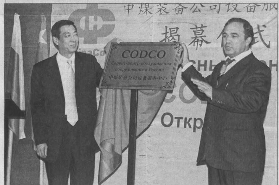
Торжественное открытие сервисного центра горношахтного оборудования Codco в Новокузнецке.